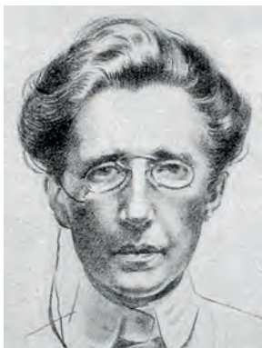
Е. Д. Стасова