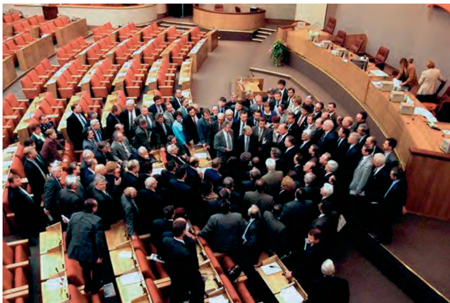
Экстренное заседание фракции КПРФ в зале заседаний Государственной Думы