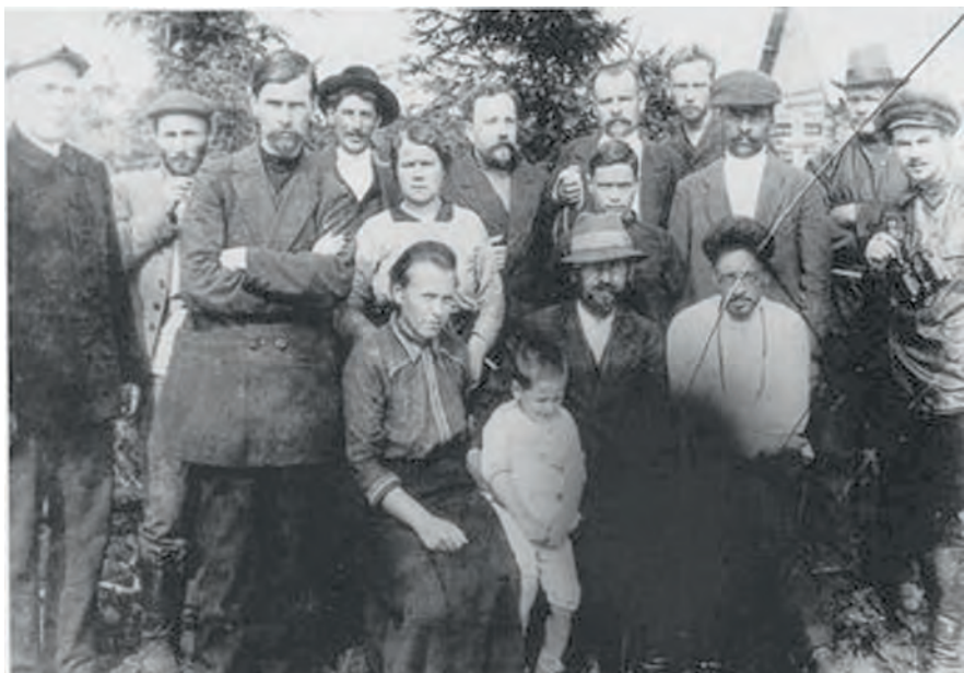
И. В. Сталин, Я. М. Свердлов и другие сильные