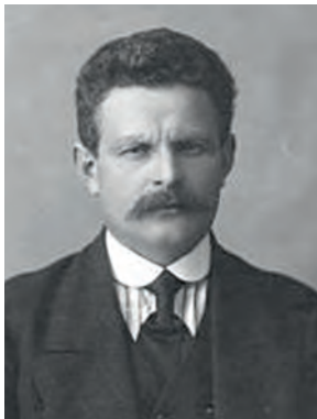
Р. В. Малиновский