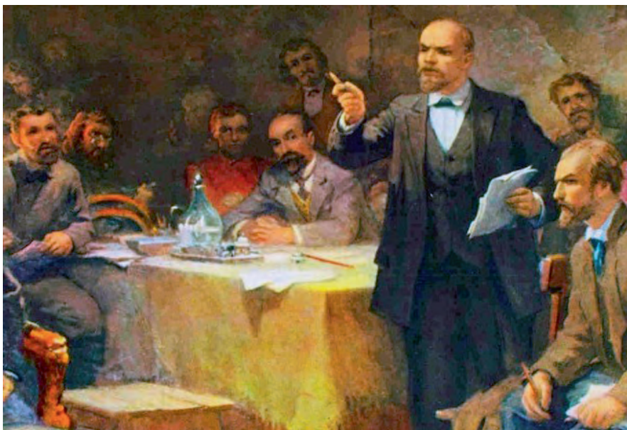
В. И. Ленин на II съезде РСДРП