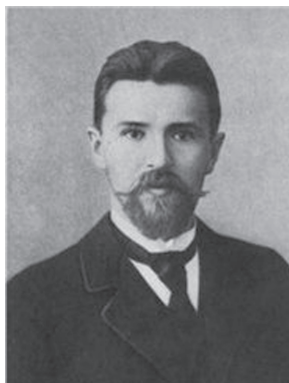
В. В. Воровский