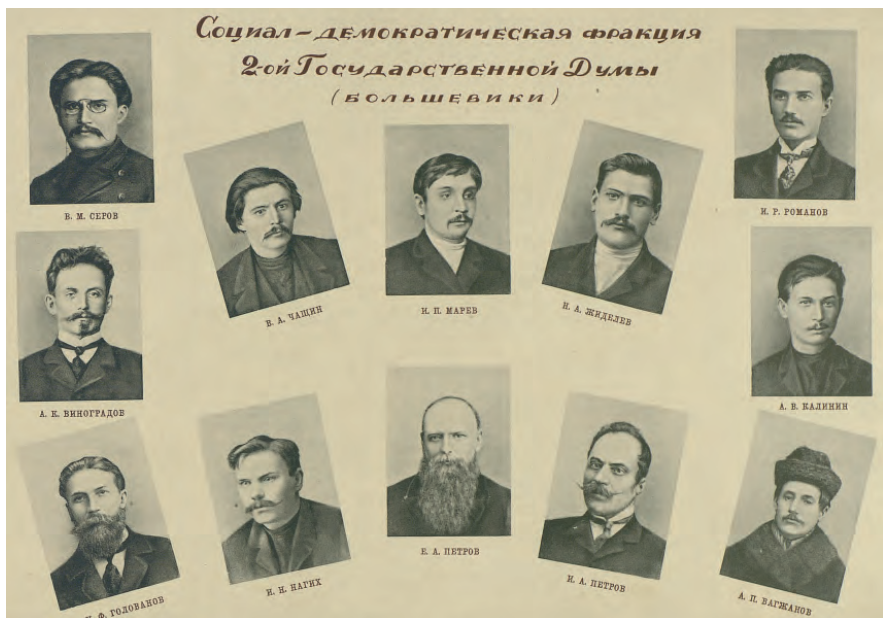
Большевики во II Государственной думе