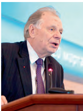
Ж. И. Алфёров