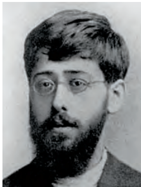
Ю. О. Мартов