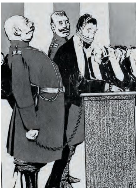
В Государственной думе. Карикатура