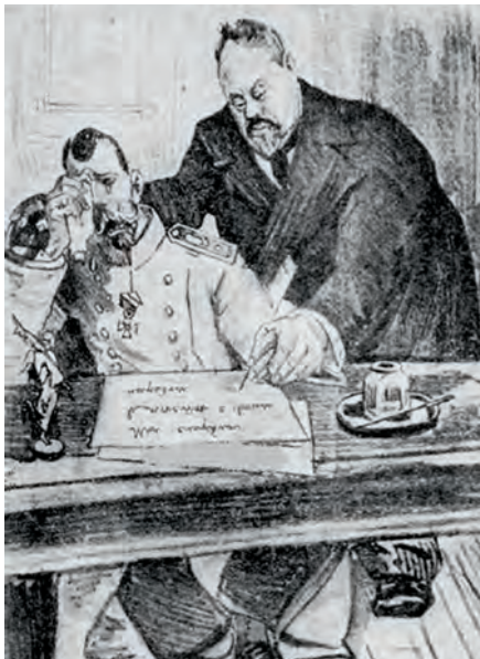
Подписание Манифеста 17 октября 1905 года. Карикатура