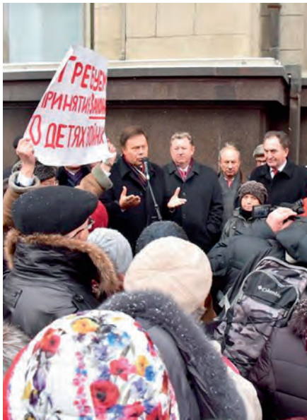
Депутаты фракции КПРФ у стен Государственной Думы протестуют вместе с народом