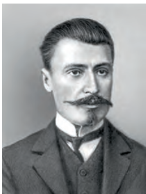
И. Г. Церетели