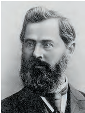
П. Б. Аксельрод