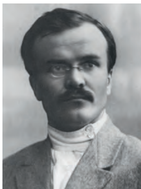
В. М. Молотов