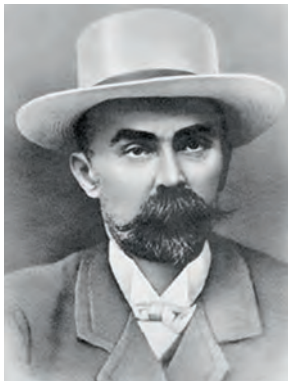
Г. В. Плеханов