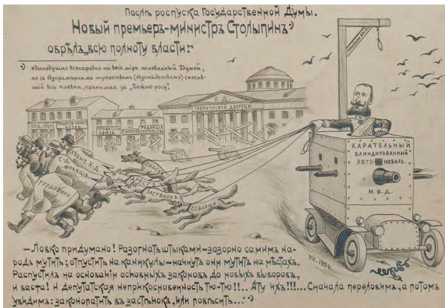
Столыпинщина. Карикатура начала XX в.