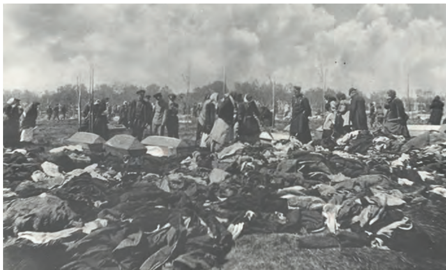
Ленский расстрел рабочих в 1912 году