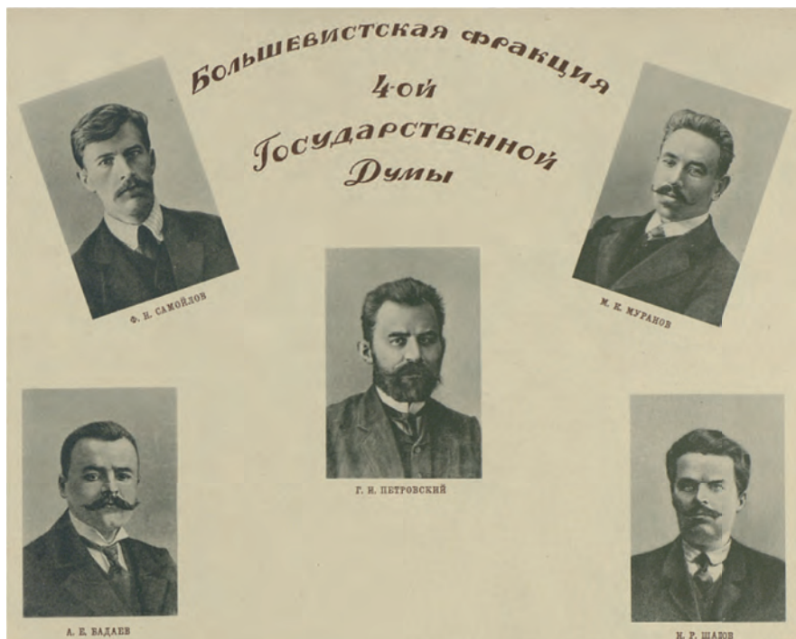
Большевистская фракция IV Государственной думы