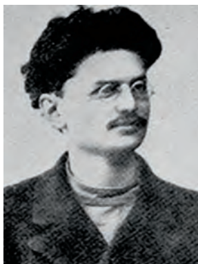
Л. Д. Троцкий