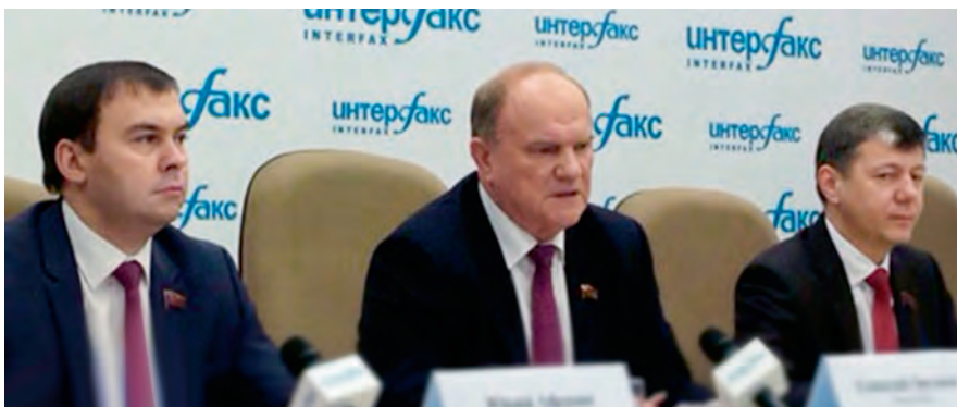
Председатель ЦК КПРФ Г. А. Зюганов и его заместители Ю. В. Афонин и Д. Г. Новиков