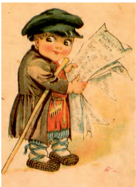
Трудовик. Открытка начала XX в.