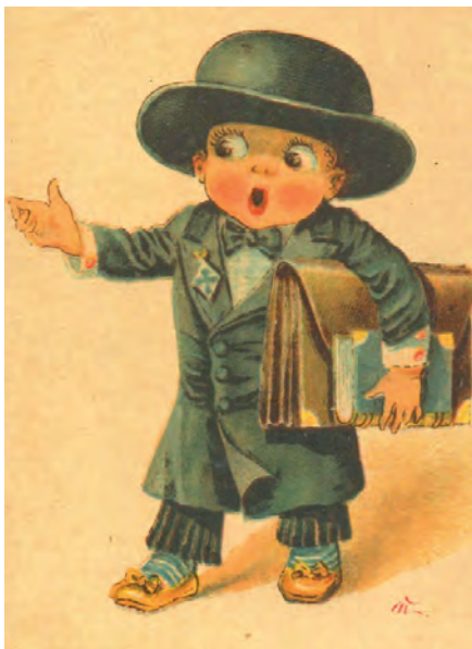
Кадет. Открытка начала XX в.