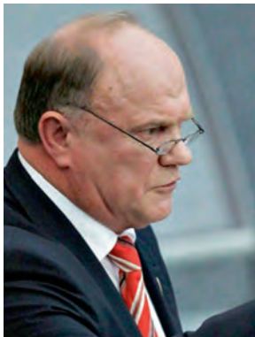
Г. А. Зюганов