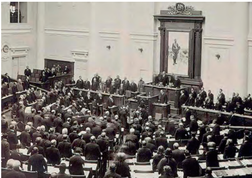
Открытие Государственной думы