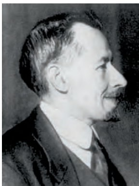
Г. А. Алексинский