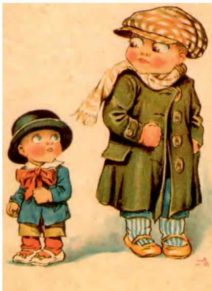
Большевик и меньшевик. Открытка начала XX в.