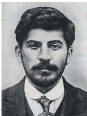
И. В. Сталин