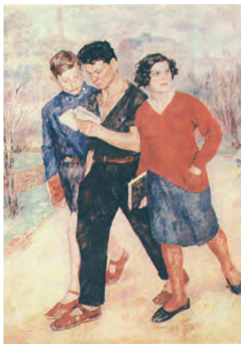
Йогансон. Рабфак идёт. 1928 год