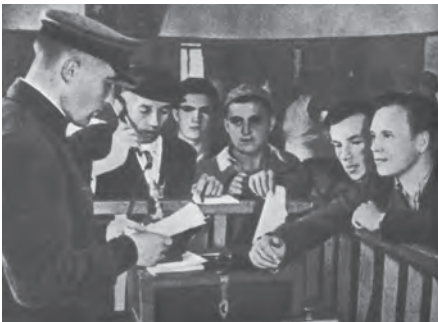
23 июня 1941 года. Запись добровольцев на фронт

22 июня 1941 года вероломное нападение фашистской Германии прервало мирное развитие Страны Советов. Над страной прозвучал призыв партии – «Родина в опасности!». Комсомол со всей стремительностью юных душ ответил на него. Великая Отечественная стала решающей проверкой духовных и физических сил советской молодёжи, комсомола.