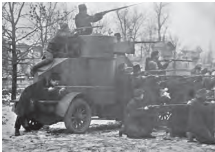
Великая Октябрьская социалистическая революция. Красногвардейцы у броневика «Лейтенант Шмидт», захваченного у юнкеров. 25 октября 1917 года

Несмотря на громадность поставленной задачи, партия не забыла и о будущем – о юношестве. На съезде специально обсуждался вопрос о союзах рабочей молодёжи. Резолюция VI съезда отмечала: «В настоящее время, когда борьба рабочего класса переходит в фазу непосредственной борьбы за социализм, съезд считает содействие созданию классовых социалистических организаций рабочей молодёжи одной из неотложных