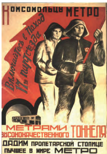
Плакат «Комсомольцы метро»

Но комсомол не только шёл в фарватере планов пятилеток, руководствуясь ленинским наказом – вносить во всякое дело свою инициативу, свой почин – он вставал на передовую идей и планов. Так, после того как в «Правде» в 1929 году была опубликована работа В. И. Ленина «Как организовать соревнование?», комсомол выступил инициатором Всесоюзного социалистического соревнования. В соревнование за снижение себестоимости, за повышение качества продукции первыми вступили комсомольские организации заводов и фабрик Москвы, Ленинграда, Урала. Повсеместно создавались молодёжные ударные бригады. Соцсоревнование охватило всю страну и стало общенародным делом.