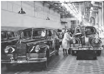
Сборка легковых автомобилей ЗИС-110 на Московском автомобильном заводе, 1946 год

нивалась прежде всего по тому, как она сумела мобилизовать молодёжь на выполнение пятилетнего плана.