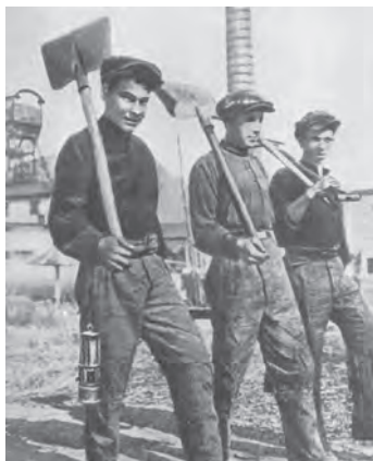
Комсомольцы на одной из строек первой пятилетки

Страна совершала гигантский рывок в будущее – путь, который европейские страны прошли за сто лет, ей удалось пройти за 17. И везде на передовой были комсомольцы. История сохранила немало примеров трудового героизма советской молодёжи. Так, при прорыве на строи-