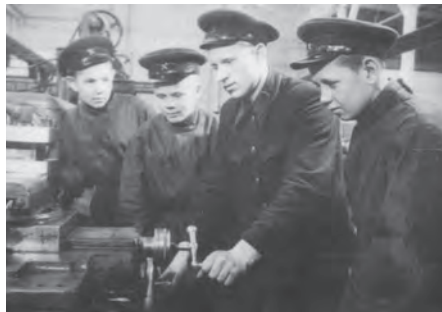
Казанское ремесленное училище № 3, 1951 год