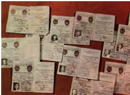
Комсомольские билеты членов «Молодой гвардии»

но. Тогда вперёд пополз Александр. Он подобрался к дзоту и бросил внутрь гранату. Огонь прекратился, но не надолго – вскоре немцы возобновили огонь. Комсомолец вскочил на ноги и бросился на амбразуру, прямо на вражеские пулемёты, закрыв их телом. Бойцы воспользовались паузой и рванулись вперёд.