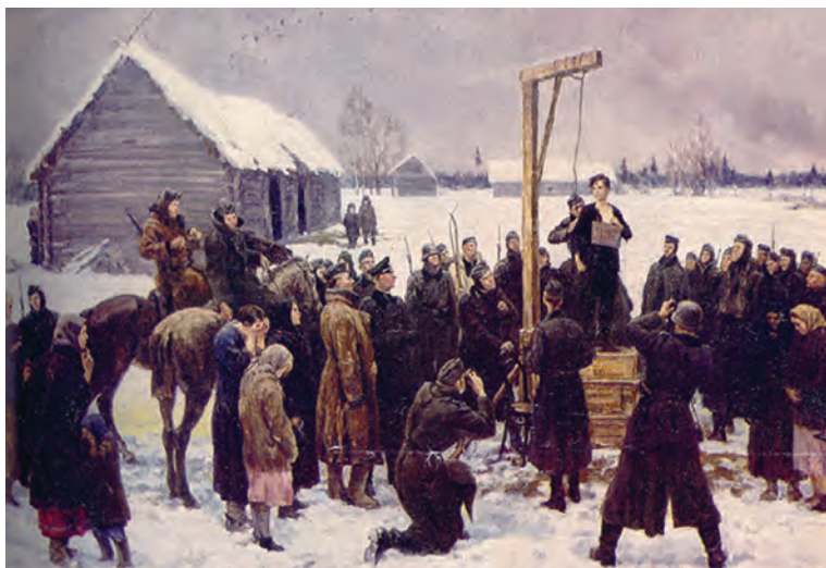
Казнь комсомолки Зои Космодемьянской фашистами

В день юбилея Красной Армии – 23 февраля 1943 года – на привале в лесу состоялось комсомольское собрание батальона. Обсуждался один вопрос: как лучше выполнять боевой приказ – взять деревню Чернушки.