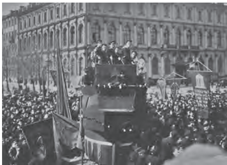
Демонстрация матросов в Петрограде

задач момента и вменяет партийным организациям в обязанность уделить работе этой возможный максимум внимания». Ставя точку в дискуссии о социалистических союзах молодёжи, съезд выказался за то, чтобы их деятельность носила организационно самостоятельный характер.