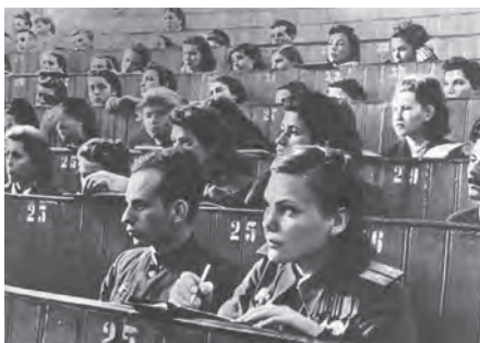
МГУ им. М. В. Ломоносова. Первая лекция после войны

В руинах лежал ДнепроГЭС, были взорваны домы Запорожья, затоплены шахты Донбасса, пеплом и гарью покрылись древнейшие города Руси. По призыву партии и советского правительства миллионы рабочих рук решительно принялись за восстановления страны и в первых рядах