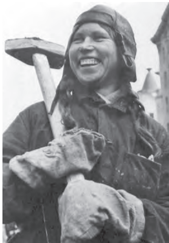
Комсомолка-проходчица московского метростроя. 1934 год

За первые сталинские пятилетки комсомол дал Родине много квалифицированных специалистов. В их числе 118 тысяч инженеров и техников, 69 тысяч специалистов сельского хозяйства, 19 тысяч учителей с высшим образованием, многие десятки тысяч других специалистов.