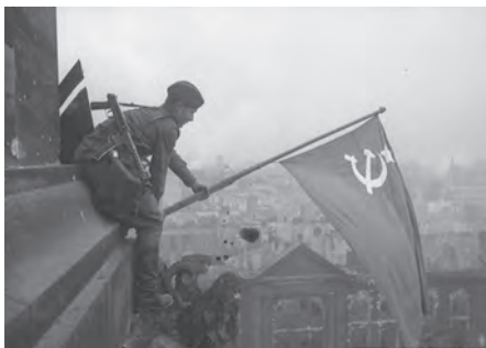
Знамя Победы над Берлином

В небольшом городке Краснодоне, в Донбассе, группа юношей и девушек создала подпольную организацию. Ею руководил семнадцатилетний комсомолец Олег Кошевой. «Молодая гвардия» успешно боролась с врагом. Подпольщики совершали нападения на оккупантов, спасали население от угона на работу