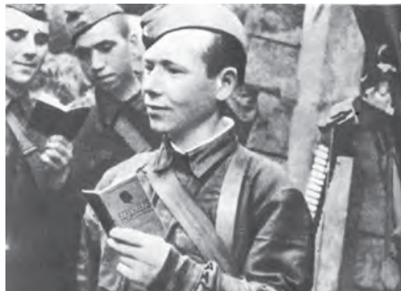
Приём в комсомол на передовой

«Правда» первой рассказала сражающейся стране о подвиге комсомолки Зои Космодемьянской. Ей было восемнадцать лет, она училась в 10-м классе школы № 201 Октябрьского района Москвы. Когда началась война, она пошла в комитет комсомола и попросила направить её в партизанский отряд. Желание Зои было