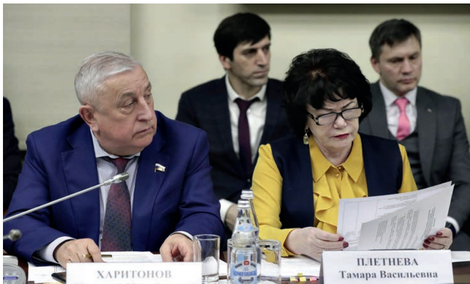
Заседание рабочей группы Государственной Думы по реализации положений ежегодных посланий Президента Российской Федерации Федеральному Собранию Российской Федерации (здание Государственной Думы, 4 февраля 2020 года). На фото: председатель Комитета Государственной Думы по региональной политике и проблемам Севера и Дальнего Востока Н. М. Харитонов, председатель Комитета Государственной Думы по вопросам семьи, женщин и детей Т. В. Плетнева