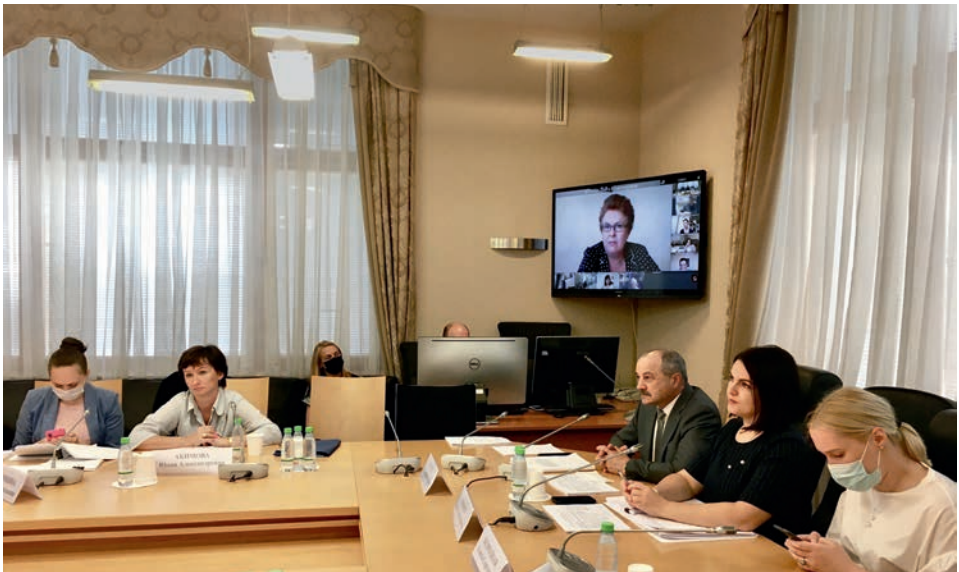
Рабочее совещание по доработке проекта федерального закона № 879343-6 3 июля 2020 года (в режиме видеоконференцсвязи)