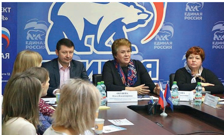
Первый заместитель председателя Комитета О. В. Окунева на тематической встрече, посвящённой национальному проекту «Демография» и новым мерам поддержки семей (г. Смоленск, Региональная общественная приёмная партии «ЕДИНАЯ РОССИЯ», 29 января 2020 года)