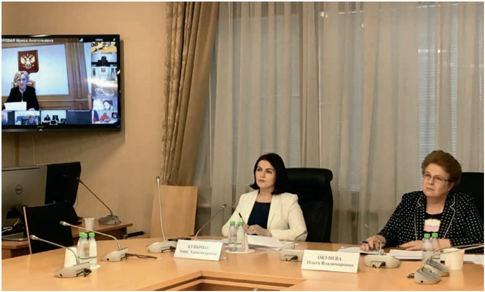
Рабочее совещание по доработке проекта федерального закона № 879343-6 2 июля 2020 года (в режиме видеоконференцсвязи)