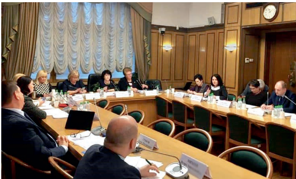
Специальное (расширенное) заседание Комитета (12 марта 2020 года)

23 июня 2020 года проведено в режиме видеоконференцсвязи заседание Комитета на тему «Организация отдыха и оздоровления детей летом 2020 года».