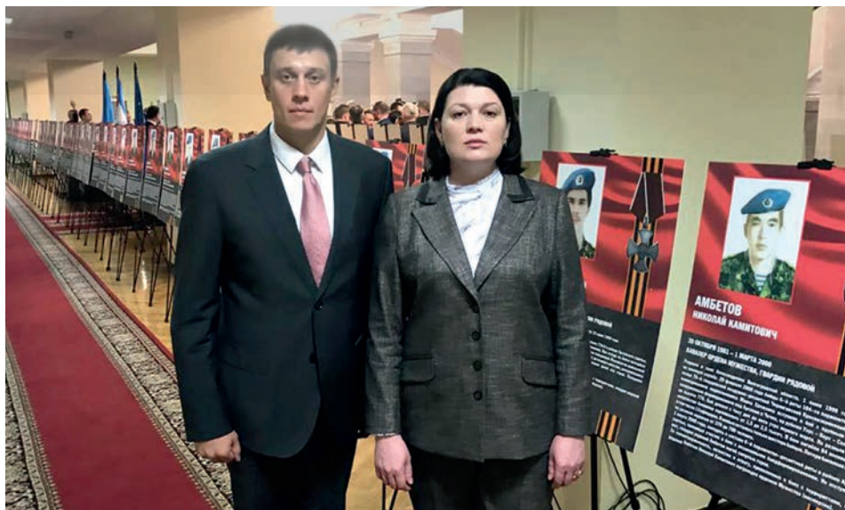
Открытие выставки, посвящённой 20-летию подвига 6-й роты 104-го гвардейского парашютно-десантного полка 76-й Псковской дивизии Воздушно-десантных войск (фойе второго этажа здания Государственной Думы (Охотный ряд, д. 1), 12 февраля 2020 года). На фото: депутат Государственной Думы В. Л. Пашин, член Комитета В. В. Кулиева