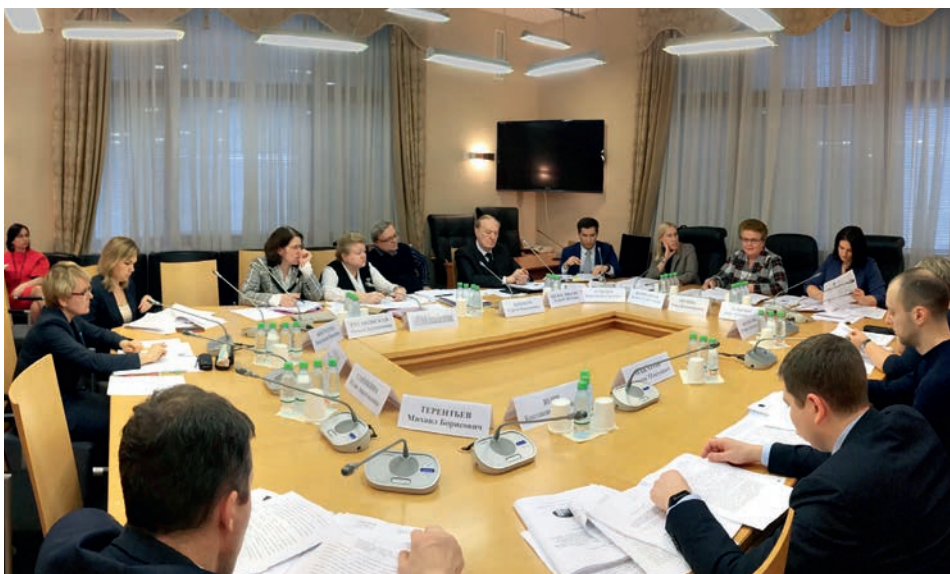
Заседание рабочей группы по доработке проекта федерального закона № 879343-6 (2 марта 2020 года)