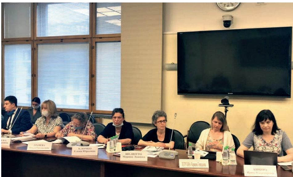
Рабочее совещание по доработке проекта федерального закона № 879343-6 (7 июля 2020 года)