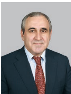
НЕВЕРОВ Сергей Иванович, руководитель фракции Всероссийской политической партии «ЕДИНАЯ РОССИЯ»