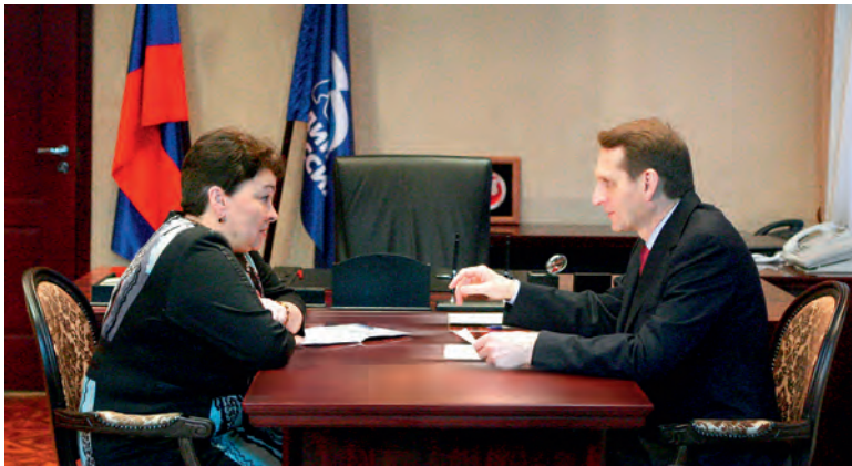
Депутат С.Е. Нарышкин ведёт приём по личным вопросам в г. Кировске Ленинградской области

Аллея из дубов и лип посажена во дворе всеволожской школы № 7 и посвящена всем жителям Ленинградской области, погибшим при выполнении служебных обязанностей. Акция прошла в рамках проекта «Герои нашего времени», который курирует областное отделение «Молодая гвардия».