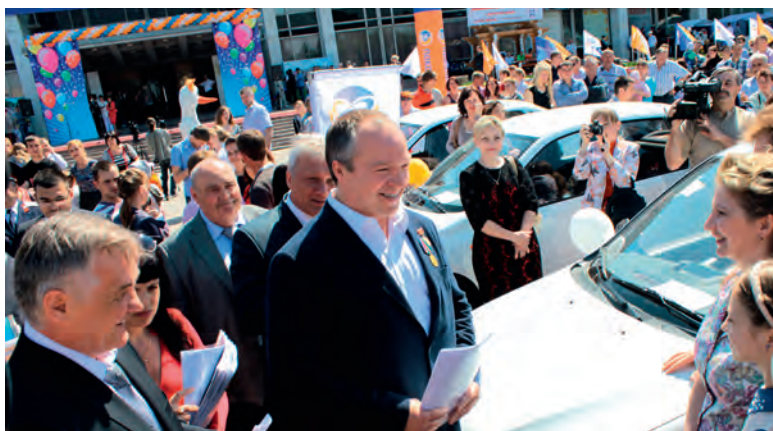
Депутат А.В. Скоч на мероприятии по вручению многодетным семьям Белгородской области автомобилей

...А подарки ждали и депутата. Андрею Скочу торжественно присвоено звание «Почётный гражданин Старооскольского городского округа».