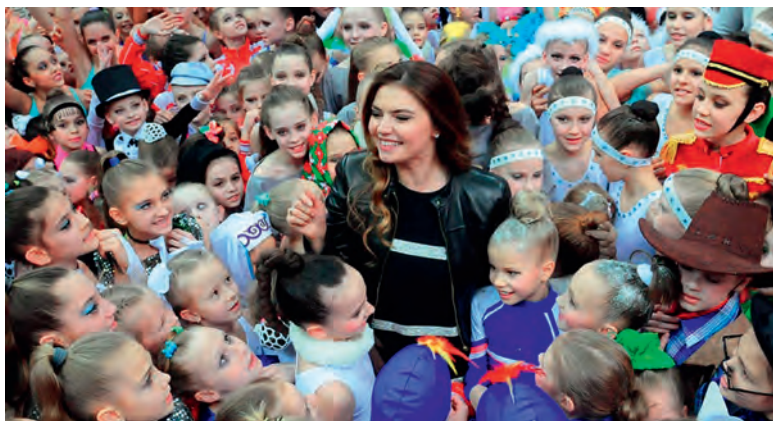
Депутат А. М. Кабаева с участниками международного турнира по художественной гимнастике в г. Нижнекамске

Проведение турнира не помешало депутату решить и ряд других вопросов, с которыми обращались на приём избиратели: помочь с выделением квоты на проведение операции в Москве, с получением путёвки в детский сад поблизости от дома, разобраться в ситуации, связанной с невыплатой заработной платы специалистам, участвовавшим в строительных работах за рубежом.