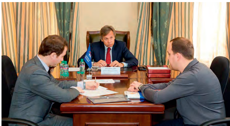
Депутат А. К. Пушков проводит приём по личным вопросам в Пермском крае

В ходе личного приёма граждан в Региональной общественной приёмной Председателя Всероссийской политической партии «ЕДИНАЯ РОССИЯ» Д. А. Медведева в Пермском крае поступило коллективное обращение с просьбой о запрете эксплуатации незаконно возведённого подземного сооружения, представляющего угрозу для жизни и здоровья граждан, о привлечении лиц, причастных к его возведению и эксплуатации, к уголовной ответственности. По итогам приёма направлены запросы в Следственный комитет Российской Федерации и Генеральную прокуратуру, в результате чего незаконная деятельность по эксплуатации подземных гаражных боксов приостановлена, прокуратурой подан иск о запрете дальнейшей эксплуатации. Следственным управлением Следственного комитета Российской Федерации по Пермскому краю возобновлено уголовное дело по привлечению виновных лиц к ответственности, проводится расследование.