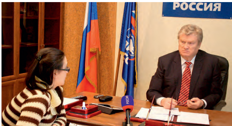
Депутат В. А. Язев ведёт приём по личным вопросам в г. Мурманске

На контроле у депутата Валерия Язева остаётся решение проблемы жителей Кольского Заполярья, пострадавших в прошлом году от действий компании «РРТ Северо-Запад» – дилера марки «Субару». Не получившие после полной предоплаты своих автомобилей, северяне обращались в суд, который удовлетворял их иски, но взыскать деньги со счетов компании пострадавшим не удаётся. Парламентарий тесно взаимодействует с УМВД России по Мурманской области, проводящим расследование по заявлению граждан.