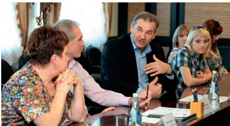
Депутат В. А. Третьяк встречается с избирателями Ульяновской области