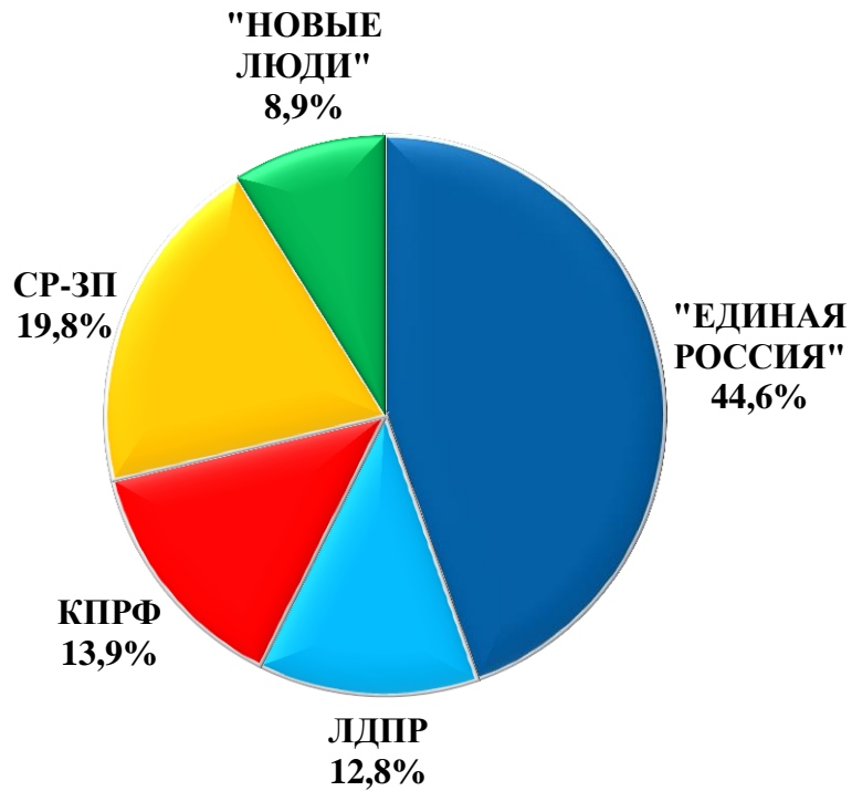
Диаграмма 3. Обращения, поступившие во фракции в ГД