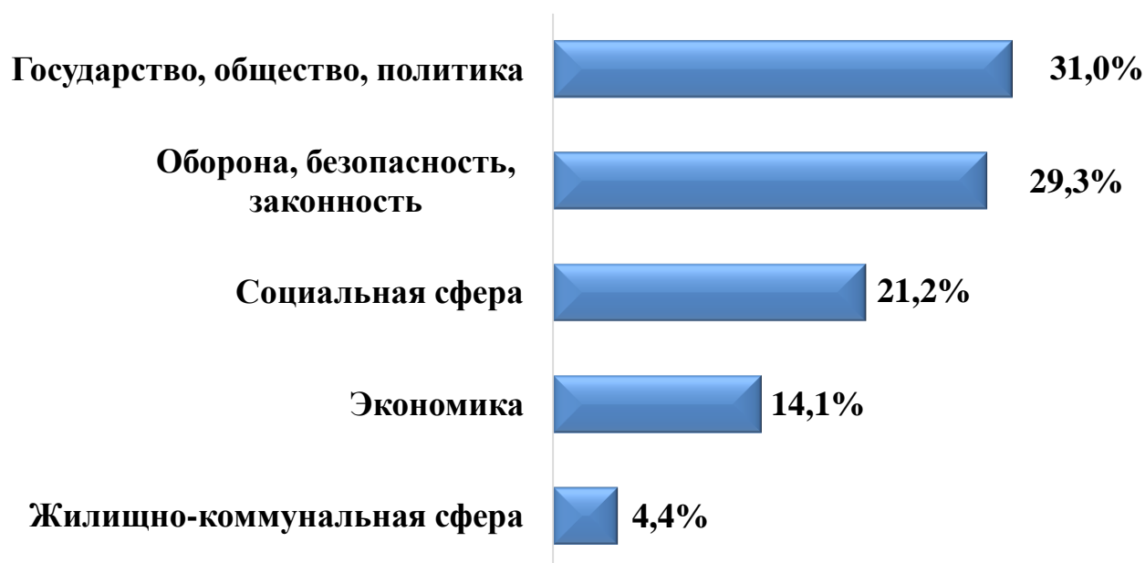
Диаграмма 4. Темы, выбранные гражданами при обращении в ГД

По вопросам ведения Государственной Думы поступило 3 122 обращения.