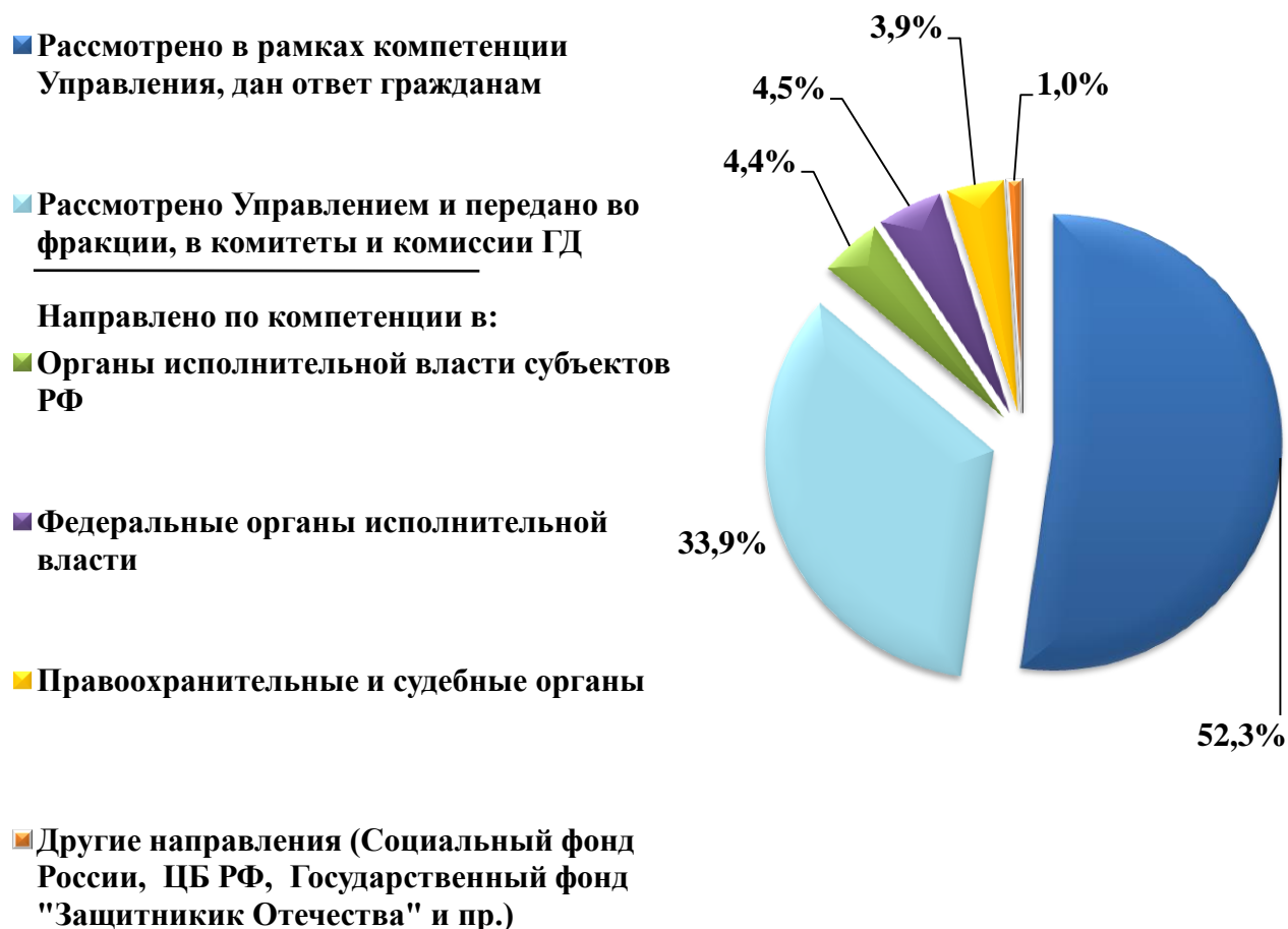
Диаграмма 5. Обращения, рассмотренные Управлением

Государственными гражданскими служащими Управления по работе с обращениями граждан рассмотрено 6 931 обращение, из которых 955 обращений направлено по компетенции.