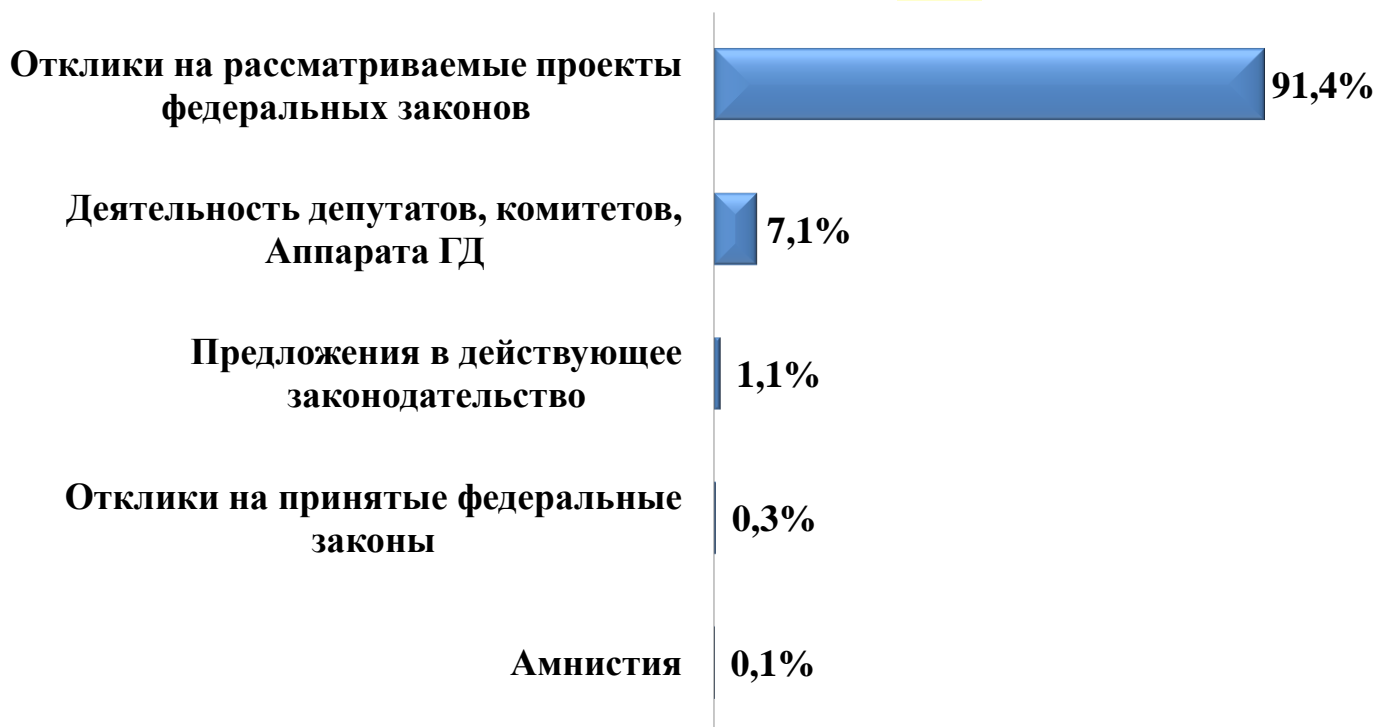
Диаграмма 6. Темы, выбранные гражданами по вопросам ведения ГД

По вопросам ведения Государственной Думы поступило 3 122 обращения.