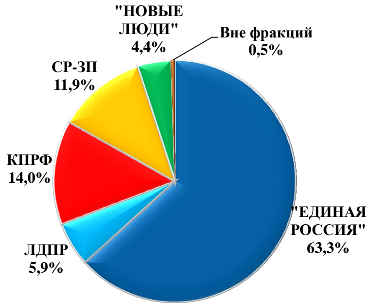
Диаграмма 2. Распределение обращений по фракционной принадлежности