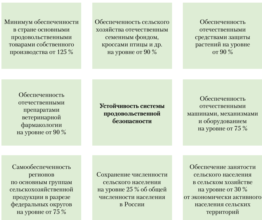
Рис. 3. Принципиальные аспекты, необходимые к учету в параметрах пороговых значений продовольственной безопасности в контексте сбалансированного развития сельских и редкоселенных территорий