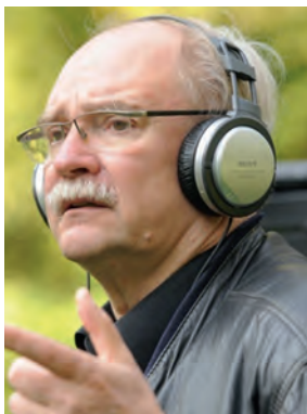
В. В. Бортко