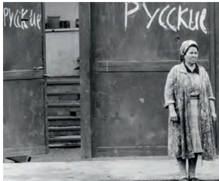
Трагедия межнациональной войны. Баку. 1990 год