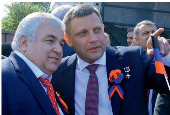
Соратники. Депутат Государственной Думы К. К. Тайсаев и Глава ДНР А. В. Захарченко