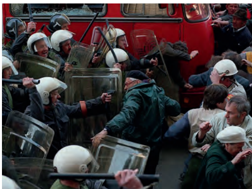
Столкновения 1 мая 1993 г. в Москве

Подводя итог этого непростого в жизни КПРФ периода, вновь предоставим слово внепартийному историку и политологу Рою Медведеву: «Избирательные кампании 1995–1996 гг. – по выборам в Думу, по выборам Президента Российской Федерации, а также по губернаторским и местным выборам – стали главным испытанием для КПРФ после её восстановления в начале 1993 года. В основном партия выдержала это испытание, она смогла бороться с режимом на равных, она показала себя наиболее организованной политической силой в стране, способной проводить крупнейшие политические кампании. КПРФ не смогла победить на этих выборах, но смогла получить важные рычаги влияния в Государственной Думе и Совете Федерации, а также во многих областях и городах России. По итогам избирательных кампаний 1995 и 1996 годов всем было видно, что именно КПРФ составляет главную силу оппозиции и что нельзя игнорировать партию, за которую голосует от 30 до 40 % избирателей» [41, с. 214].