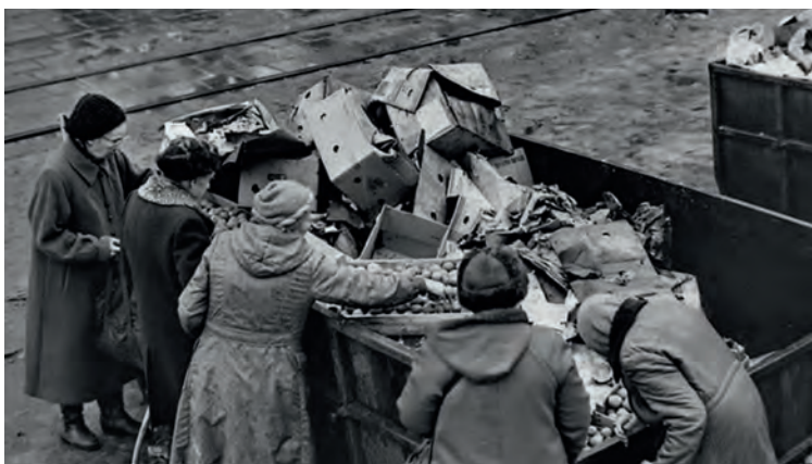
Результат гайдаровских реформ