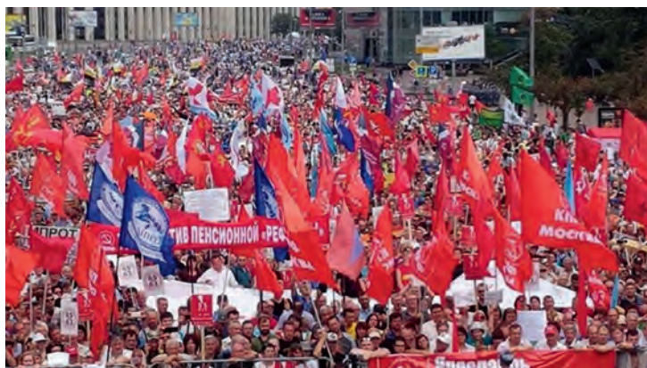
Митинг КПРФ против «пенсионной реформы». Москва, июль 2018 г.