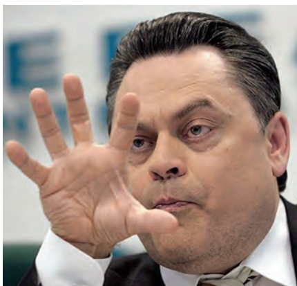
Так Г. Семигин хотел «наложить лапу» на КПРФ