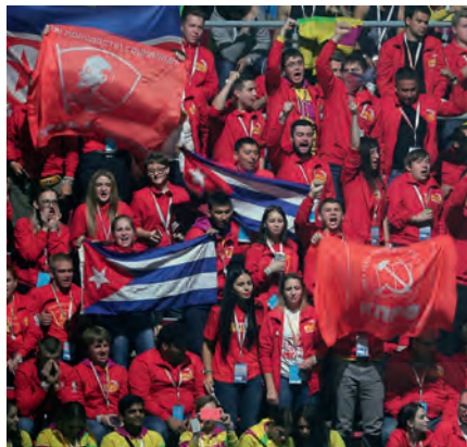
XIX Всемирный фестиваль молодёжи и студентов в Сочи