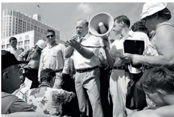
С шахтёрами у Дома Правительства