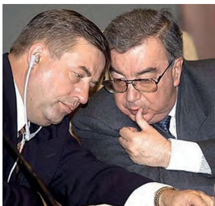
Г. Н. Селезнев и Е. М. Примаков