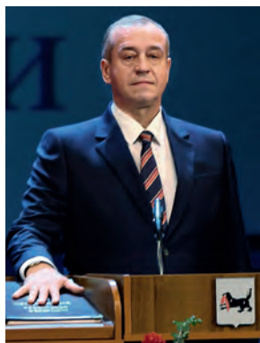
С. Г. Левченко приносит губернаторскую присягу