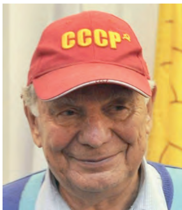
Ж. И. Алфёров, лауреат Нобелевской премии по физике, член фракции КПРФ в Государственной Думе

И ещё. «События, развернувшиеся вокруг X съезда КПРФ, со всей очевидностью указали и на огромную жизнеспособность Компартии, и на нарастающие трудности в ней, на необходимость для коммунистов самым серьёзным образом проанализировать своё положение в стране и выработать целостную программу развития партии и собственных действий на обозримую перспективу» [88, с. 219].