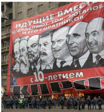
Очередная провокация против КПРФ