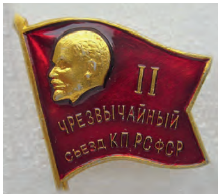
Значок делегата II Чрезвычайного съезда КП РСФСР