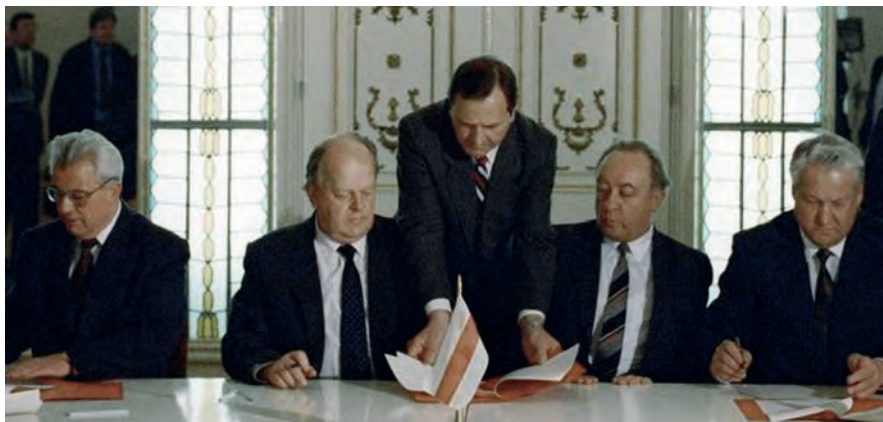
Могильщики великой страны