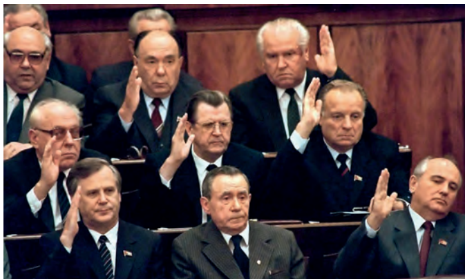
Пока ещё единогласно. Политбюро ЦК КПСС. 1986 г.

До крушения Коммунистической партии Советского Союза оставалось чуть более двух недель. «Её центральный организм оказался начисто лишённым деятельной и целенаправленной политической воли, – подытоживал впоследствии Г. А. Зюганов. – Попытка восполнить этот пробел созданием Компартии РСФСР не дала ожидаемого эффекта. Не хватило времени. Да и деятельность КП РСФСР разворачивалась в крайне осложнённых условиях. Против неё, с благословения ЦК КПСС, был открыт огонь практически всех СМИ» [27].