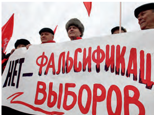
КПРФ против фальсификаторов выборов