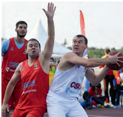
КПРФ против ЛДПР. Соперники не только на политическом поле