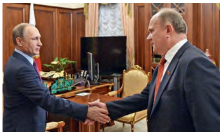
Март 2014 г. Шаг навстречу