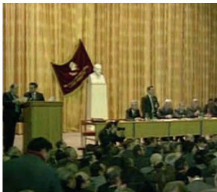
Репортаж с восстановительного съезда российских коммунистов. Февраль 1993 г.