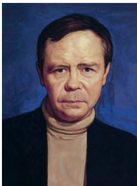
В. Г. Распутин