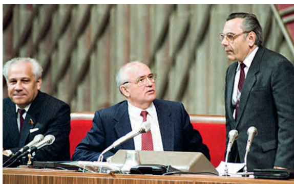
На Учредительном съезде КП РСФСР. Избрание И. К. Полозкова лидером партии. Июнь 1990 г.