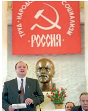
Открытие III съезда КПРФ 21 января 1995 г.