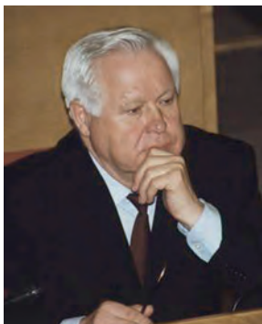
Первый секретарь ЦК КП РСФСР В. А. Кушцов