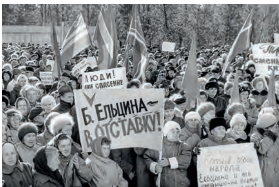
Разочарование в кумире