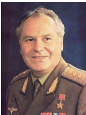
Г. С. Титов, второй космонавт планеты, член фракции КПРФ в Государственной Думе