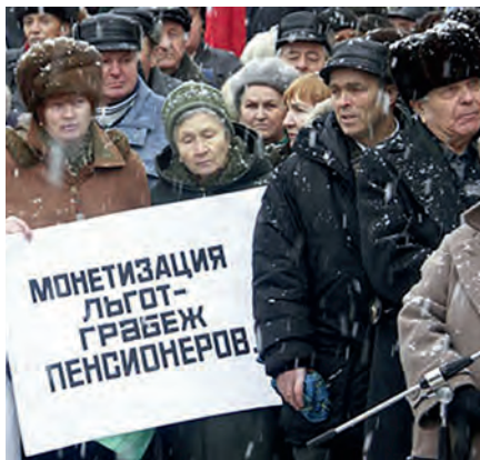
Массовый народный протест. Январь 2005 г.

Всего три года потребовались КПРФ чтобы не просто справиться со спровоцированной извне ситуацией «разброда и шатаний» – с той ситуацией, которую многие «независимые» политологи называли «безнадёжной», – но и обеспечить устойчивое развитие по всем ключевым направлениям. Эти три года навсегда войдут в историю партии как время новаторства и упорной борьбы.