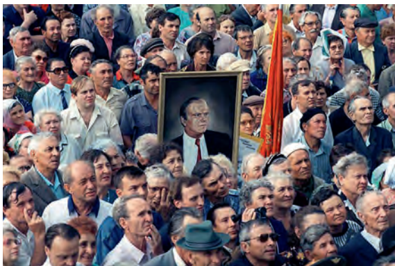
С надеждой на перемены!