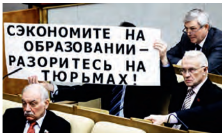
Против уничтожения российской науки и образования