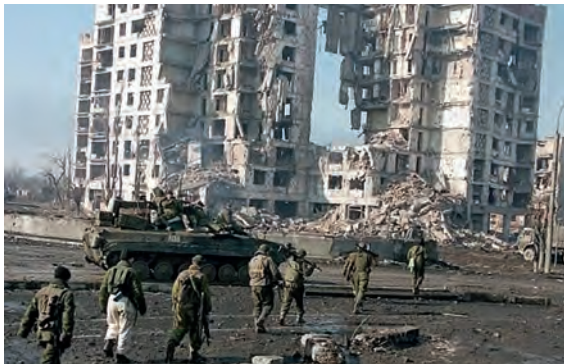
Уничтоженный Грозный. Январь 1995 г.