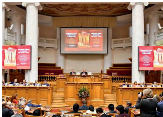
Международная встреча по случаю 100-летия Октября в Таврическом дворце Петербурга