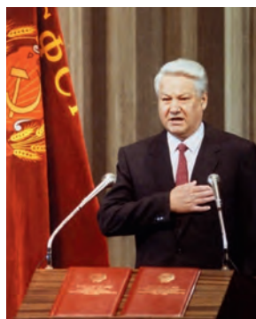
Ельцин приносит президентскую присягу на Конституции РСФСР, которую расстреляет в октябре 1993 г.