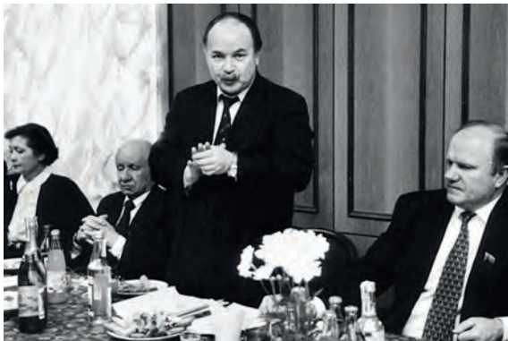
Ж. Болотова, В. Розов, Н. Губенко, Г. Зюганов