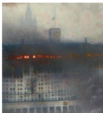
4 октября 1993 г. Апофеоз ельцинской «демократии»