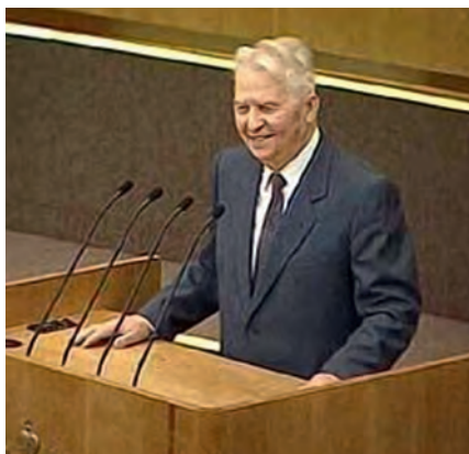
Е. К. Лигачёв открывает работу Государственной Думы третьего созыва