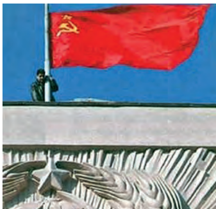
Бесстрашие. Армен Бениаминов 7 ноября 2003 года