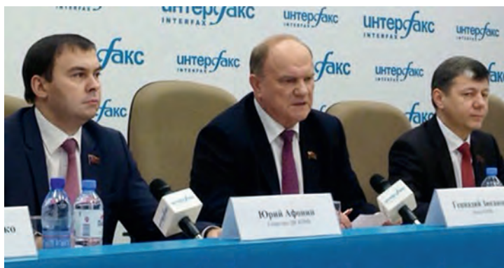
Председатель ЦК КПРФ Г. А. Зюганов и его заместители Ю. В. Афонин и Д. Г. Новиков