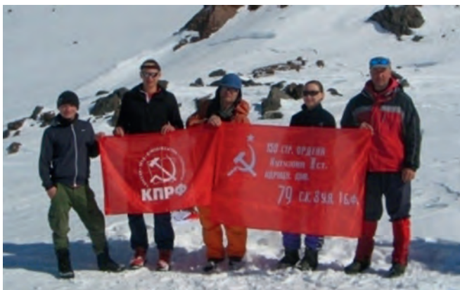
Знамя Победы и флаг КПРФ на вершине Эльбруса