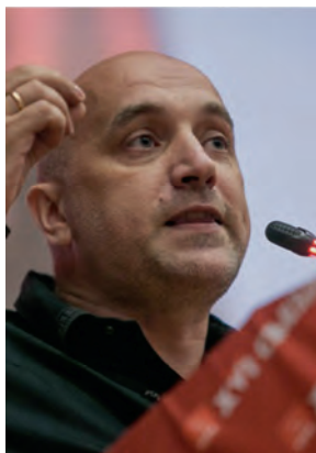
Писатель З. Прилепин выступает на XVI съезде КПРФ