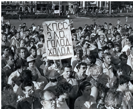
«Демократический» митинг. «Долой КПСС!»