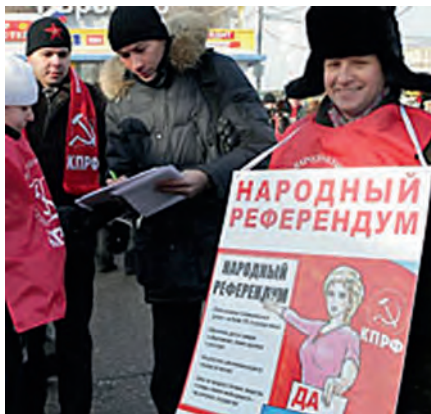
Народный референдум КПРФ