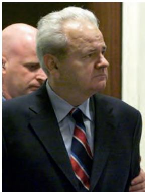
Гаагское судилище над Милошевичем