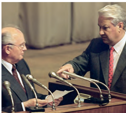
Я подписал указ о запрете КПСС

Итожа начальный этап становления КПрФ, Г. А. Зюганов отмечал: «...В 1993 году, на памятном II Чрезвычайном съезде, за разногласиями и многообразием прозвучавших на нём мнений явно обозначились две основных линии, отражавшие настроения делегатов и их видение возрождаемой партии. Значительная часть делегатов разделяла позицию «классических коммунистов», руководствовавшихся традиционными идеями и полностью опиравшихся на политический опыт КПСС, не подвергая его сколь-нибудь серьёзному критическому анализу. Однако большинство коммунистов всё же полагали, что идеология и методы работы партии в кардинально изменившихся условиях устарели и требуют решительного пересмотра» [44, с. 238].