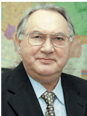
Ю. Д. Маслюков