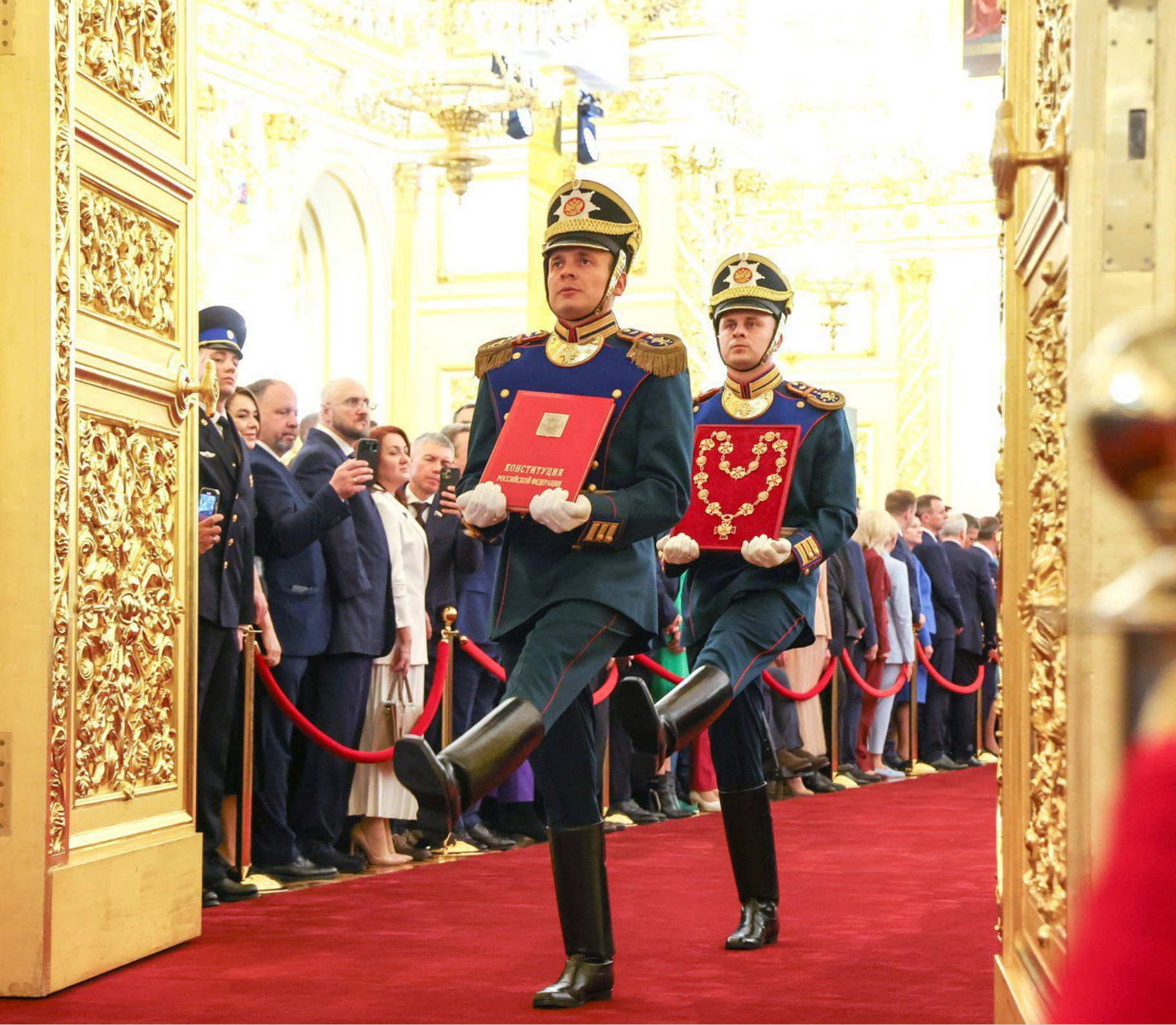
Церемония вступления В. В. Путина в должность Президента Российской Федерации, Москва, 7 мая 2024 г.