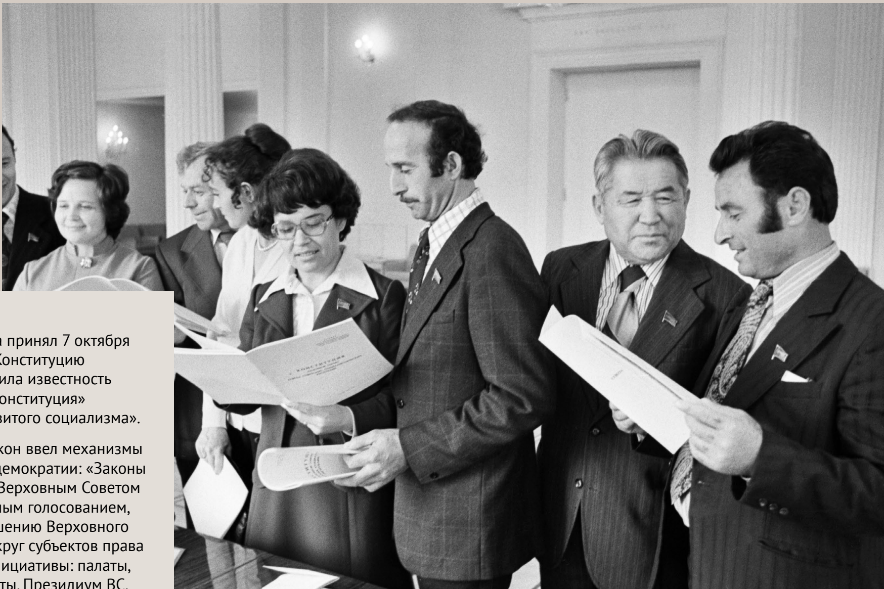
Депутаты во время ознакомления с проектом Конституции СССР, Москва, 4 октября 1977 г.

Новый основной закон ввел механизмы непосредственной демократии: «Законы СССР принимаются Верховным Советом СССР или всенародным голосованием, проводимым по решению Верховного Совета». Расширил круг субъектов права законодательной инициативы: палаты, их комиссии, депутаты, Президиум ВС, Совет Министров СССР, высшие органы власти союзных республик, Верховный Суд СССР, Генпрокурор, общественные организации в лице их общесоюзных органов.