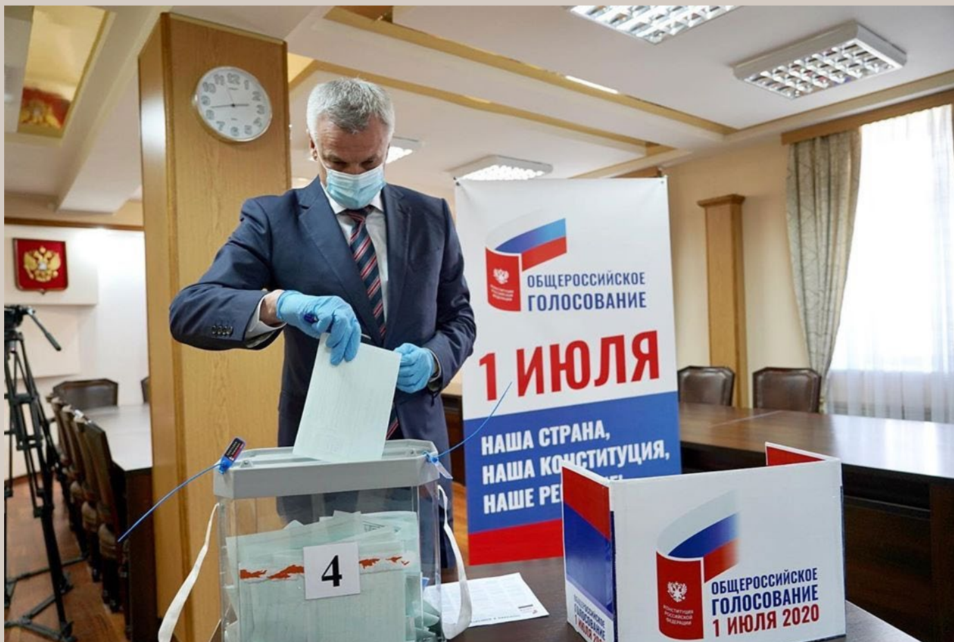
Общероссийское голосование о поправке в Конституцию РФ, Москва, 1 июля 2020 г.

Наиболее масштабные изменения внесены в рамках поправок, одобренных в ходе общероссийского голосования 1 июля 2020 г. Закреплены нормы, направленные на усиление защиты национального суверенитета и территориальной целостности, традиционных ценностей, материнства, отцовства и детства, сохранение и защиту исторической памяти, культуры народов России, русского языка, повышение уровня социальной защиты граждан.