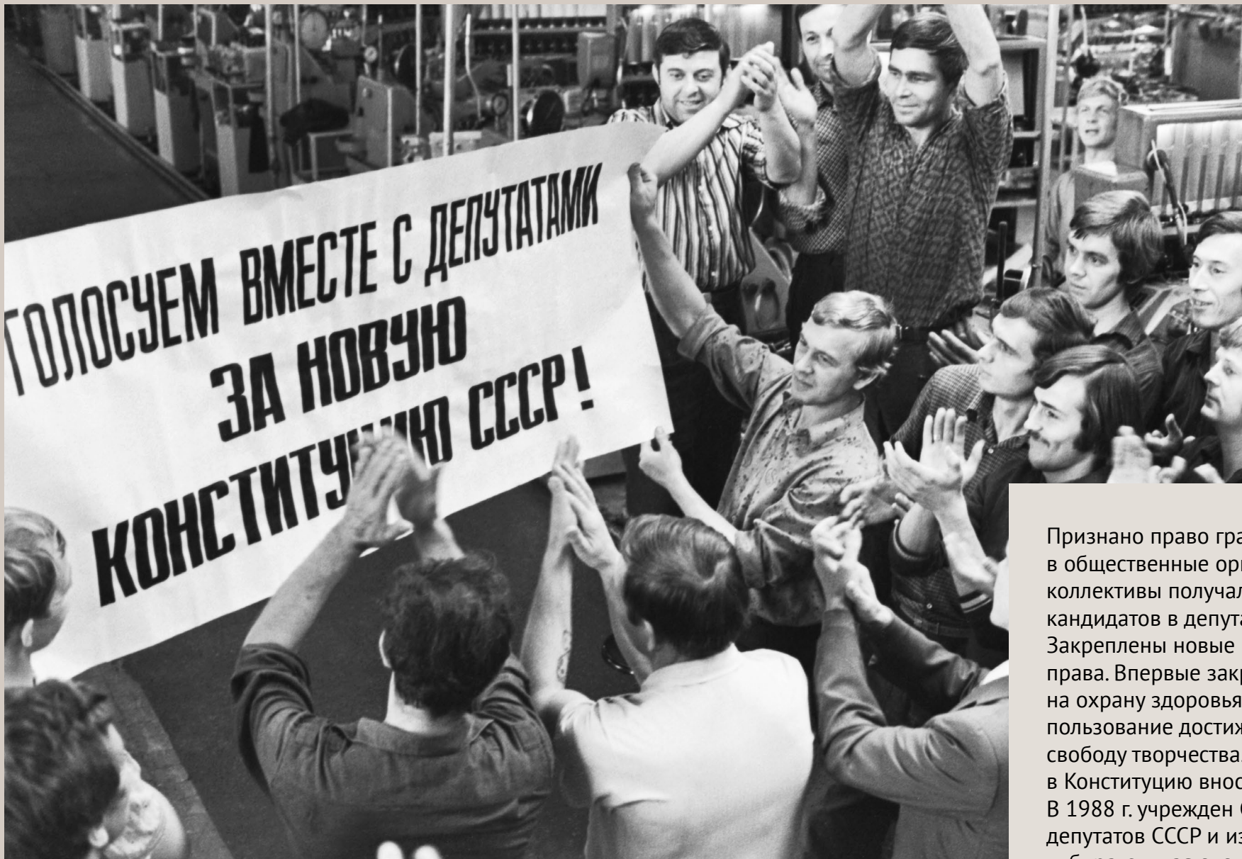
Митинг в сборочном цехе Ярославского завода топливной аппаратуры в поддержку проекта Конституции, Ярославль, 5 октября 1977 г.

Признано право граждан объединяться в общественные организации. Трудовые коллективы получали право выдвигать кандидатов в депутаты Советов. Закреплены новые гражданские права. Впервые закреплены права на охрану здоровья, жилище, пользование достижениями культуры, свободу творчества. Поправки в Конституцию вносились 6 раз. В 1988 г. учрежден Съезд народных депутатов СССР и изменена избирательная система. 14 марта 1990 г. исключена статья 6 о руководящей роли КПСС, отменена однопартийность, учрежден пост Президента СССР, введен институт частной собственности.