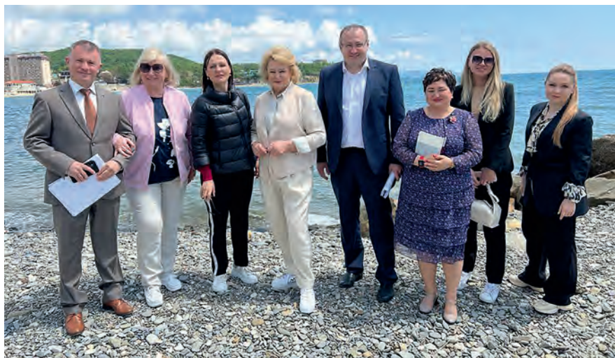
Члены Комитета с представителями Законодательного собрания и администрации Краснодарского края (Краснодарский край, апрель 2022 г.)