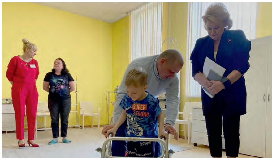
Председатель Комитета Н. А. Останина во второй раз посетила образовательный центр «Созвездие» (г. Красногорск, 29.04.2022 г.)