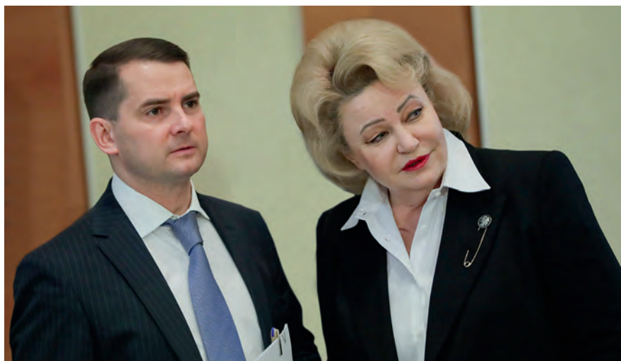
Слева направо: председатель Комитета Государственной Думы по труду, социальной политике и делам ветеранов Я. Е. Нилов, председатель Комитета Государственной Думы по вопросам семьи, женщин и детей Н. А. Останина