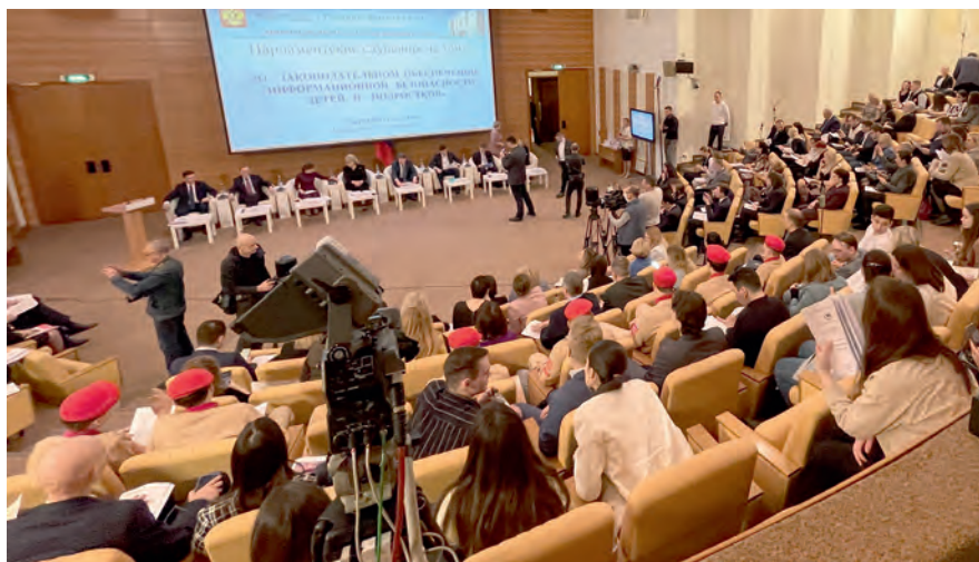
Малый зал Государственной Думы