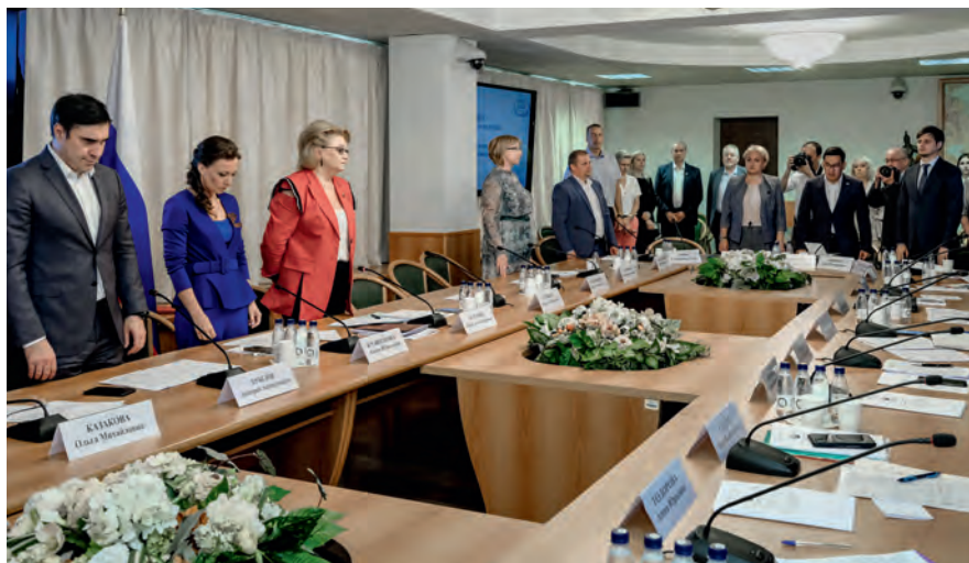
Минута молчания в память о погибших детях в Луганской и Донецкой Народных Республиках

По итогам «круглого стола» принято решение о проработке вопроса о создании межведомственной рабочей группы по социальной защите