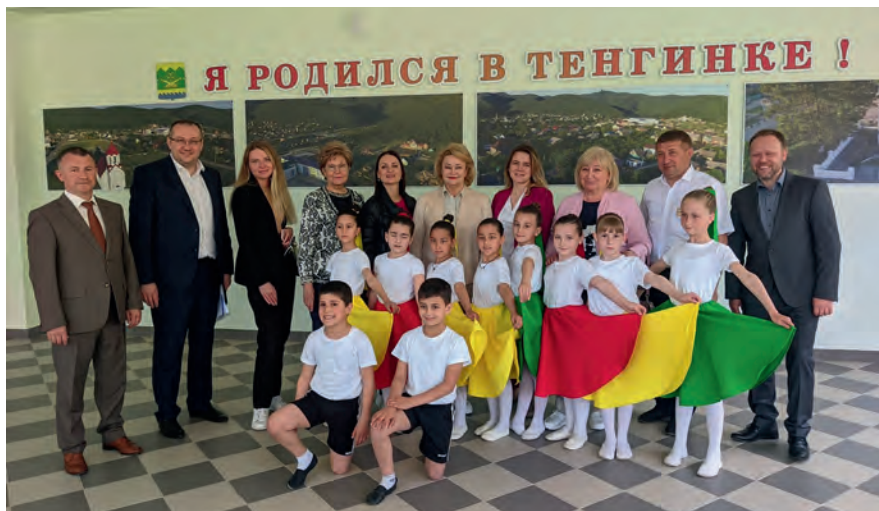
Выездное совещание Комитета. Члены Комитета с представителями Законодательного собрания и администрации Краснодарского края, учениками МБОУ СОШ № 18 им. С. В. Суворова (с. Тенгинка муниципального образования Туапсинский район, апрель 2022 г.)

Всероссийского детского центра «Орлёнок». Таким образом, депутаты ознакомились с процессом подготовки лагерей к сезону летней оздоровительной кампании 2022 года, с условиями пребывания в них детей.