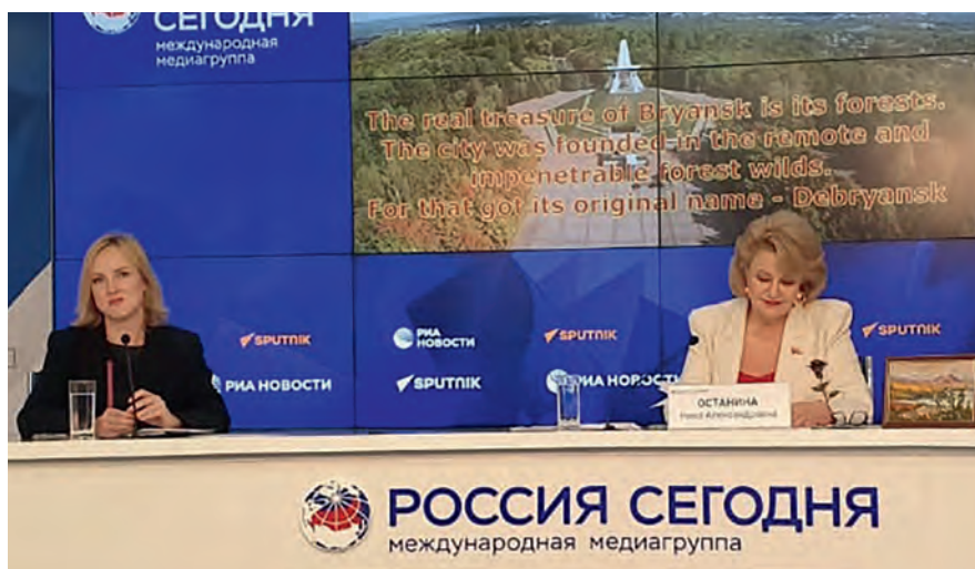
Председатель Комитета Н. А. Останина провела пресс-конференцию на площадке «Россия сегодня», приуроченную ко Дню семьи, любви и верности (г. Москва, 07.07.2022 г.)