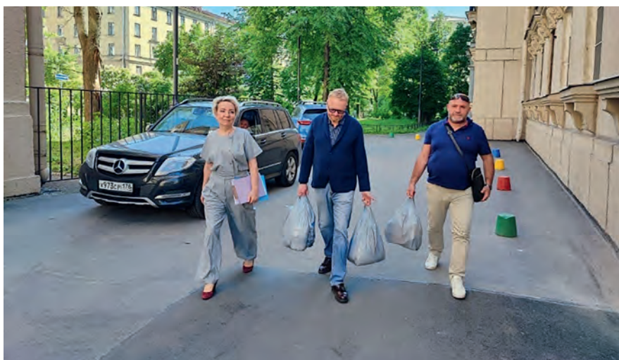
Заместитель председателя Комитета В. В. Милонов совместно с благотворительным фондом «Хайат» ежемесячно оказывают гуманитарную помощь многодетным семьям, воспитывающим детей-инвалидов (г. Санкт-Петербург, январь – август 2022 г.)