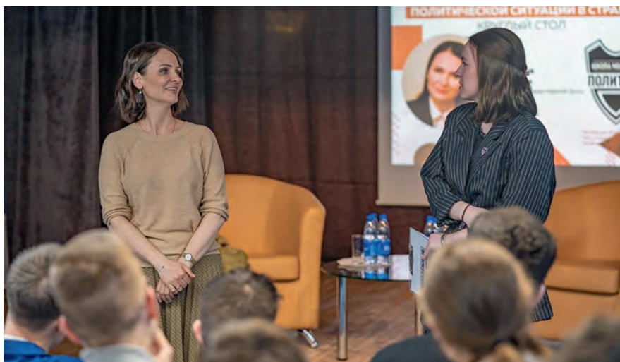
Первый заместитель председателя Комитета Т. В. Буцкая провела встречу с молодёжным парламентом города Москвы, молодёжью Восточного округа Москвы по обсуждению тем волонтёрства, психологической помощи подросткам и молодёжи, экологии и развития социальной помощи в столице (г. Москва, 18.04.2022 г.)