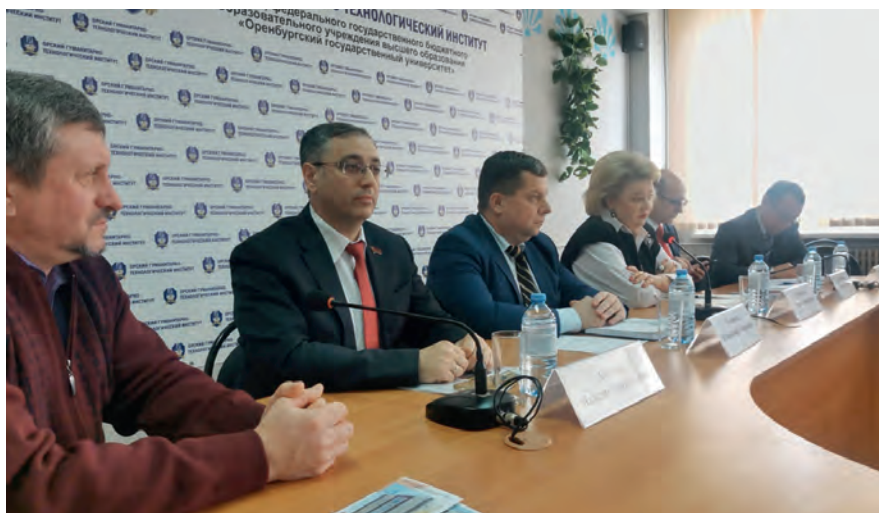
Председатель Комитета Н. А. Останина на встрече со студентами Орского гуманитарно-технологического института (г. Орск, 31.03.2022 г.)