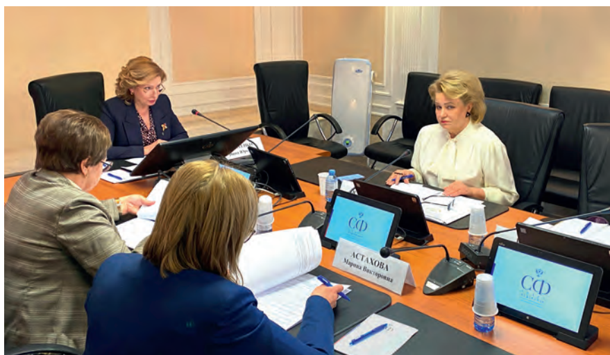
Председатель Комитета Н. А. Останина приняла участие в рабочем совещании по обсуждению проекта федерального закона № 41991-8 «О внесении изменений в статью 13 Федерального закона «О государственных пособиях гражданам, имеющим детей» и статью 111 Федерального закона «Об обязательном социальном страховании на случай временной нетрудоспособности и в связи с материнством» (Совет Федерации, г. Москва, 04.04.2022 г.)