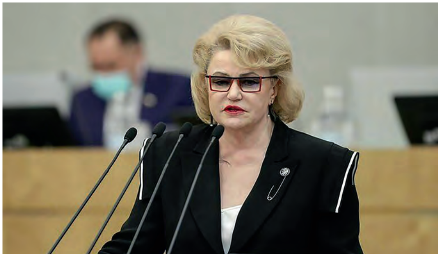
Председатель Комитета Н. А. Останина на трибуне зала пленарных заседаний

16.11.2021 г. председатель Комитета Н. А. Останина приняла участие в заседании Комитета Государственной Думы по бюджету и налогам, на котором были представлены поправки в проект федерального закона № 1258295-7 «О федеральном бюджете на 2022 год и на плановый период 2023 и 2024 годов» (г. Москва, Государственная Дума).