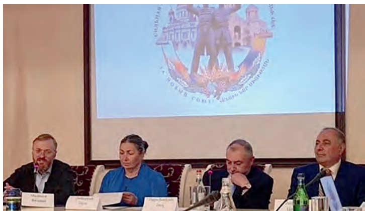
Заместитель председателя Комитета В. В. Милонов принял участие в женском форуме, организованном движением «Сильная Армения с Россией за новый Союз» (г. Ереван, Армения, 09.03.2022 г.)