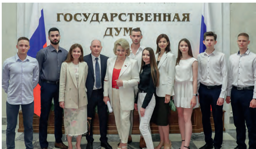
Председатель Комитета Н. А. Останина организовала встречу со студентами, уроженцами Оренбургской области (Государственная Дума, г. Москва, 06.07.2022 г.)