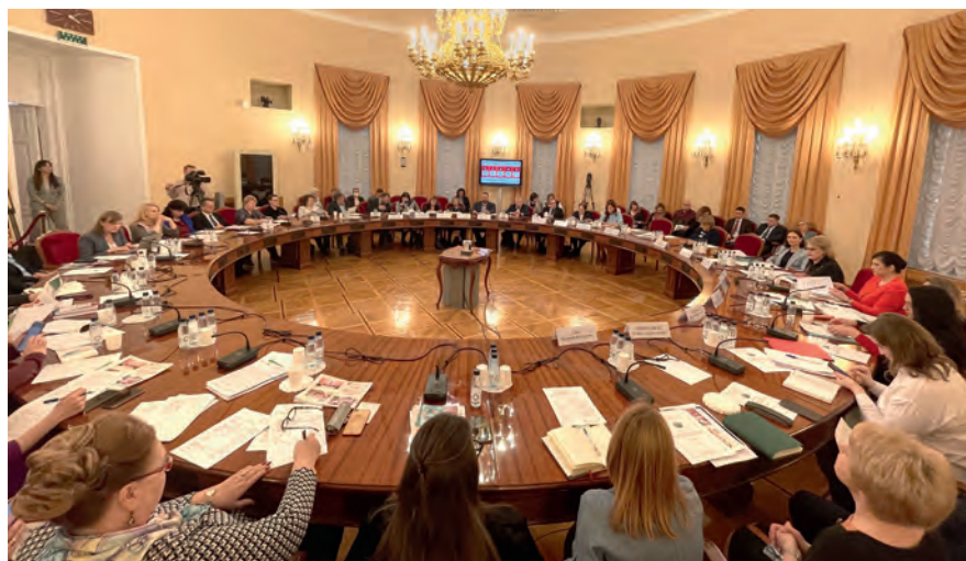
Заседание Экспертного совета Комитета