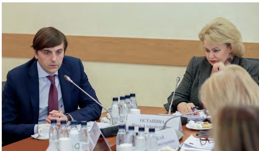
Заседание Комитета с участием министра просвещения Российской Федерации С. С. Кравцова