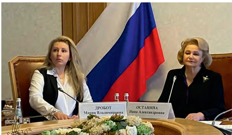
Председатель Комитета Н. А. Останина и заместитель председателя Комитета М. В. Дробот приняли участие в совместном вебинаре с фракцией Меджлиса Исламского Совета Ирана по делам женщин и семьи (Государственная Дума, г. Москва, 09.02.2022 г.)