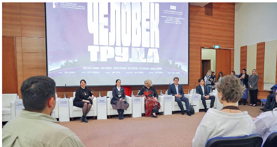
Показ российского документального фильма «Человек труда» (г. Москва, 15.11.2023 г.)

Перед показом фильма состоялась встреча со съёмочной группой.