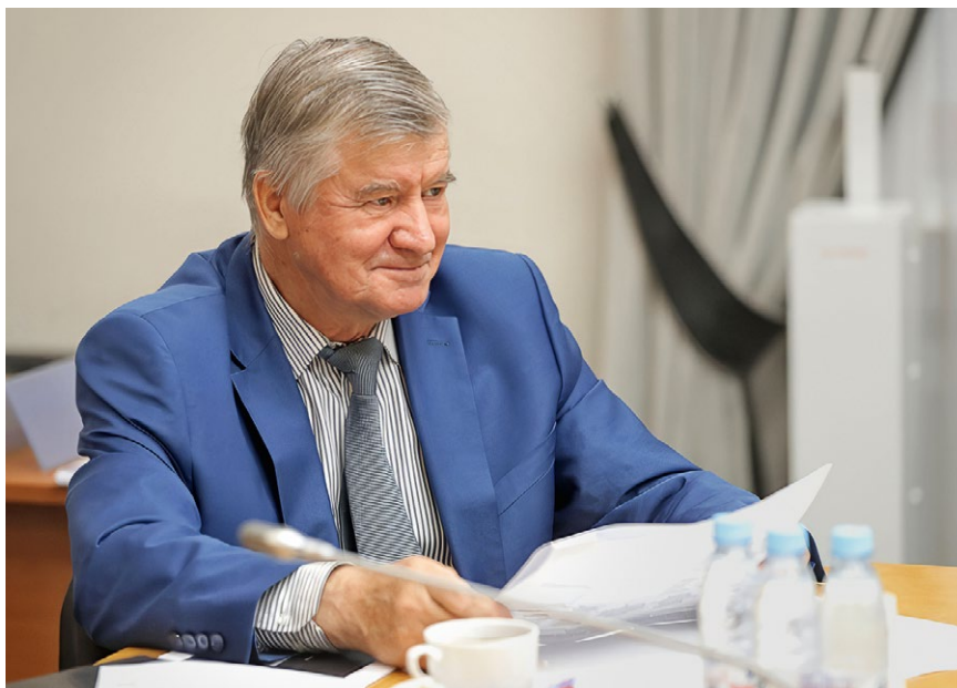
Аудитор Счётной палаты Российской Федерации С.И. Штогрин

13 марта 2024 года – заседание, посвящённое отчёту о работе Счётной палаты Российской Федерации в 2023 году с участием аудитора Счётной палаты Российской Федерации Сергея Ивановича ШТОГРИНА .