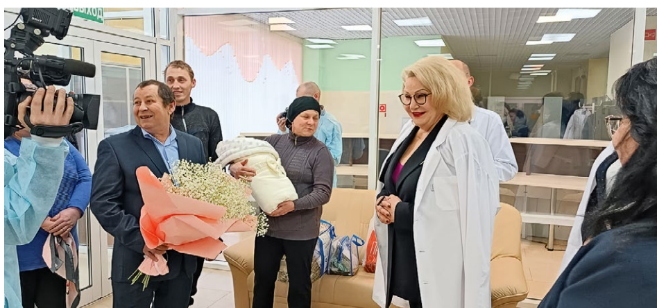
Председатель Комитета Н. А. Останина посетила перинатальный центр (г. Тамбов, 06.02.2023 г.)