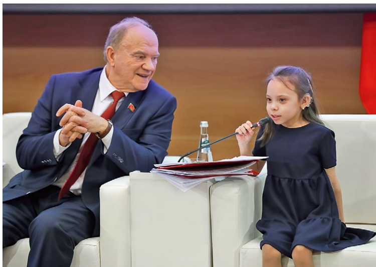
Председатель ЦК КПРФ Г.А. Зюганов