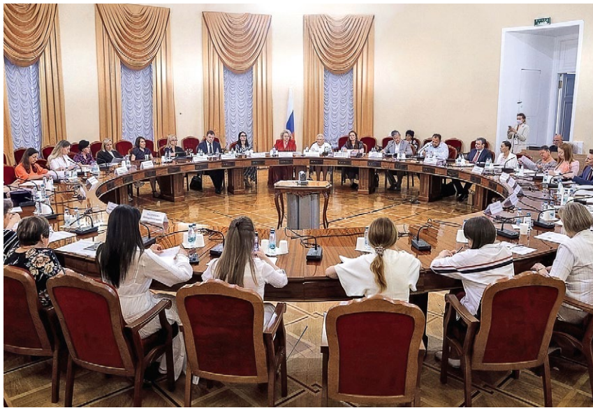
(г. Москва, 16.07.2024 г.)

16 июля 2024 года – «круглый стол» на тему «Анализ организации деятельности кризисных центров для женщин, находящихся в трудной жизненной ситуации. Выявление лучших региональных практик их функционирования в целях совершенствования действующего законодательства».