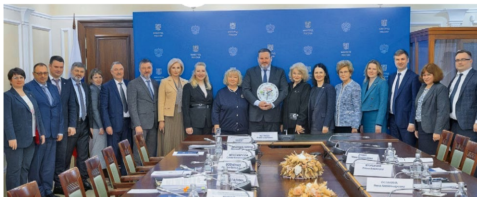
Выездное заседание Комитета в Министерство труда и социальной защиты Российской Федерации (13.11.2023 г.)