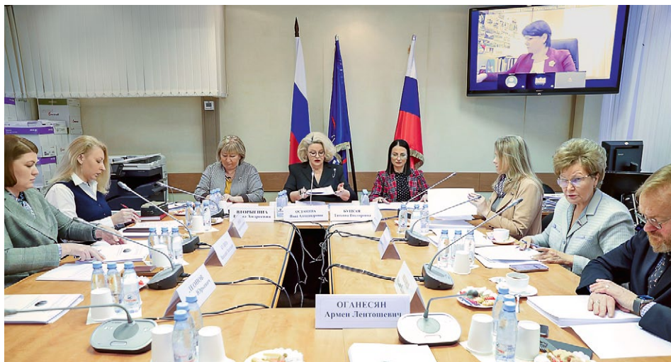
Заседание Комитета во главе с председателем Комитета Н.А. Останиной (г. Москва, 17.01.2024 г.)

26 октября 2023 года – заседание, решением которого был утверждён проект «Обращения Государственной Думы Федерального Собрания Российской Федерации «К Организации Объединённых Наций, международным парламентским организациям, парламентам стран мира в связи с массовой гибелью детей и сложившейся гуманитарной ситуацией в зоне палестино-израильского конфликта» с дальнейшим утверждением депутатами Государственной Думы на пленарном заседании 1 ноября 2023 года.