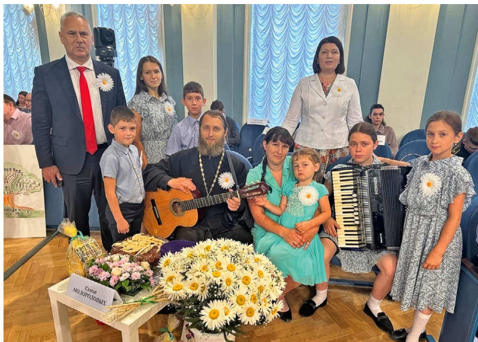
Встреча Комитета Государственной Думы по защите семьи, вопросам отцовства, материнства и детства с семьями из федеральных округов Российской Федерации (04.07.2024 г.)

10 июля 2024 года – председатель Комитета Н. А. Останина приняла участие в двусторонних переговорах и заседании межпарламентской комиссии по сотрудничеству между Федеральным Собранием Российской Федерации и Всекитайским собранием народных представителей.