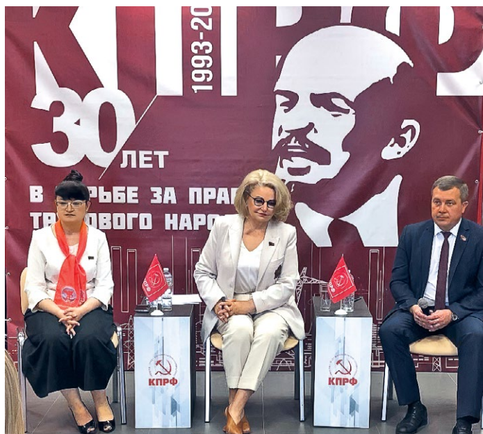
Председатель Комитета Н.А. Останина (Липецкая обл., 05.09.2024 г.)

5 сентября 2023 года – председатель Комитета Н. А. Останина приняла участие в «круглом столе» на тему «Государственная семейно-детская политика» во время рабочей поездки в Липецкую область.