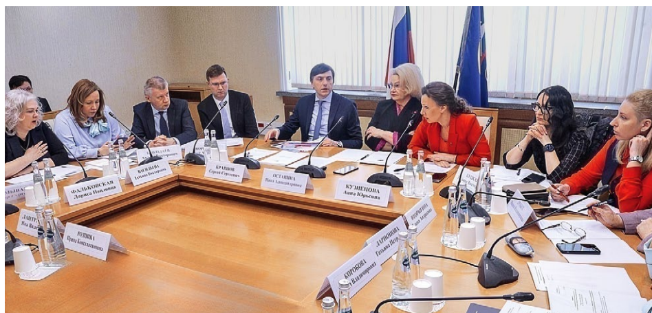
Заседание Комитета с участием Министра просвещения Российской Федерации Сергея Кравцова (г. Москва, 27.03.2024 г.)

27 марта 2024 года – заседание в рамках подготовки к рассмотрению Государственной Думой отчёта Правительства Российской Федерации о результатах его деятельности за 2023 год с участием Министра просвещения Российской Федерации Сергея Сергеевича КРАВЦОВА .