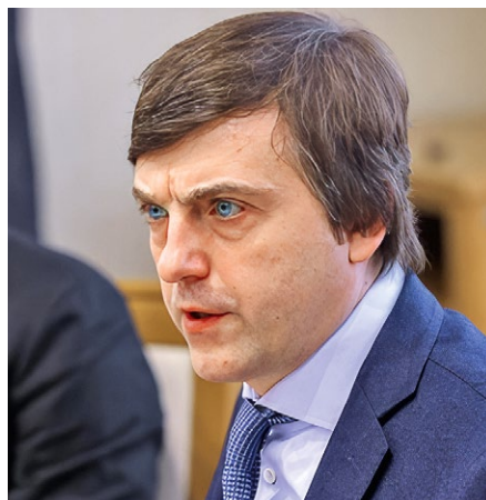
Министр просвещения Российской Федерации С.С. Кравцов

12 мая 2024 года – совместное заседание с Комитетом Государственной Думы по труду, социальной политике и делам ветеранов в рамках подготовки к утверждению Государственной Думой кандидатур Татьяны Алексеевны ГОЛИКОВОЙ на должность Заместителя Председателя Правительства Российской Федерации и Антон Олеговича КОТЯКОВА на должность Министра труда и социальной политики Российской Федерации.