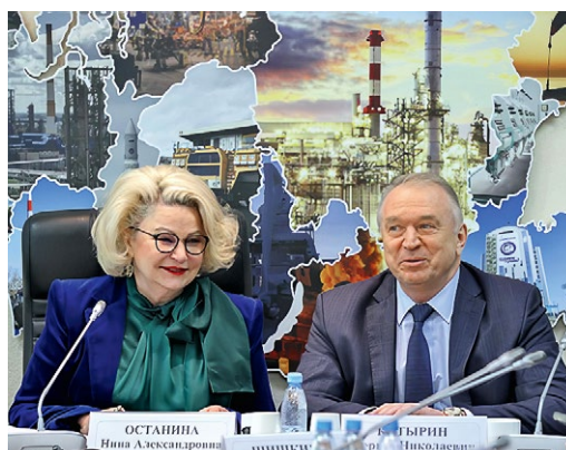
Председатель Комитета Н. А. Останина, президент Торгово-промышленной палаты Российской Федерации С. Н. Катырин

В работе приняли участие представители федеральных и региональных органов исполнительной и законодательной власти, Торгово-промышленной палаты Российской Федерации и торгово-промышленных палат субъектов Российской Федерации, представители семейного бизнеса.