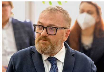
Председатель Комитета Н.А. Осталина и заместитель председателя Комитета В.В. Милонов (г. Москва, 20.09.2023 г.)