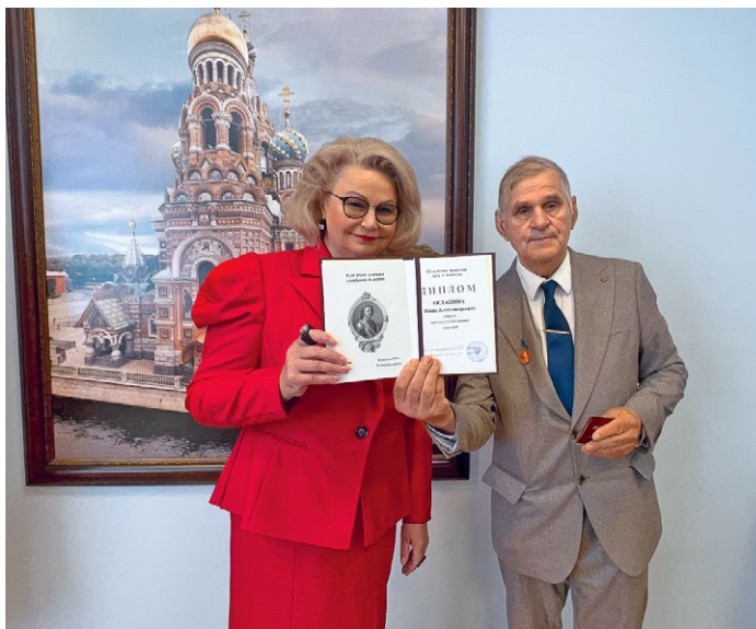
Председатель Комитета Н.А. Останина (г. Санкт-Петербург, 02.09.2024 г.)

5 сентября 2023 года – председатель Комитета Н. А. Останина приняла участие в «круглом столе» на тему «Государственная семейно-детская политика» во время рабочей поездки в Липецкую область.