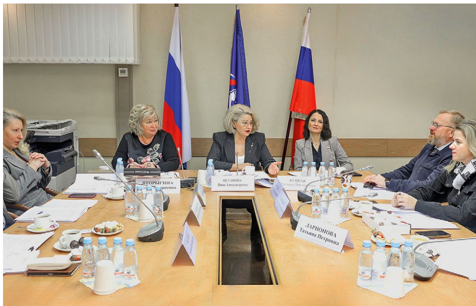
Заседание Комитета во главе с председателем Комитета Н.А. Останиной (г. Москва, 25.10.2023 г.)

12 октября 2023 года – расширенное совместное заседание с Комитетом Государственной Думы по труду, социальной политике и делам ветеранов и Комитетом Государственной Думы по контролю с участием Заместителя Председателя Правительства Российской Федерации Татьяны Алексеевны ГОЛИКОВОЙ в рамках подготовки к рассмотрению на заседании Государственной Думы 18 октября 2023 года государственного доклада о положении детей и семей, имеющих детей, в Российской Федерации.