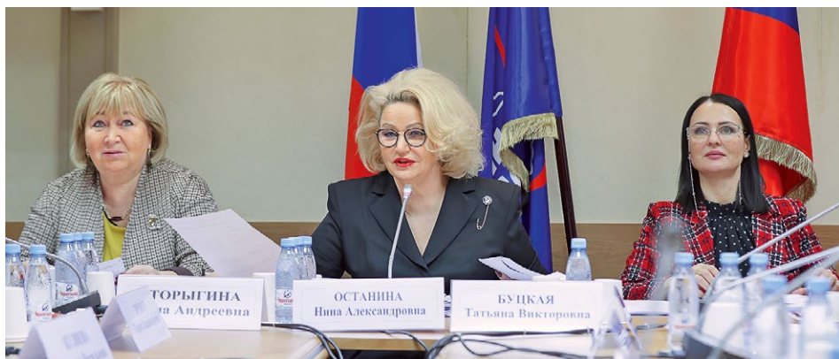
Слева направо: заместитель председателя Комитета Е.А. Вторыгина, председатель Комитета Н.А. Останина, первый заместитель председателя Комитета Т.В. Буцкая (г. Москва, 17.01.2024 г.)

Межведомственная рабочая группа по мониторингу и организации отдыха и оздоровления детей (образована Комитетом по решению Совета Государственной Думы от 04.07.2022).