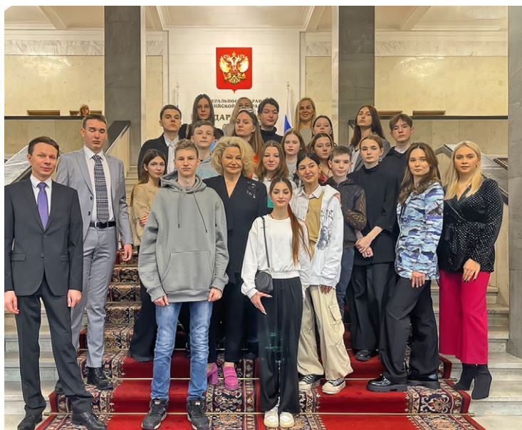
Председатель Комитета Н.А. Останина встретила с ребятами из детских домов Ивановской области (г. Москва, 15.01.2024 г.)