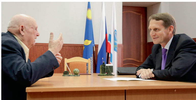
Депутат С. Е. Нарышкин на приёме по личным вопросам в Ленинградской области

роги на улице Большой Заречной. Данная дорога имеет огромное социальное значение для жителей города и является основной дорогой, ведущей к одному из самых динамично развивающихся предприятий г. Луги ООО «Форесия». Буквально через несколько недель после обращения в адрес депутата были выполнены соответствующие дорожно-строительные работы.