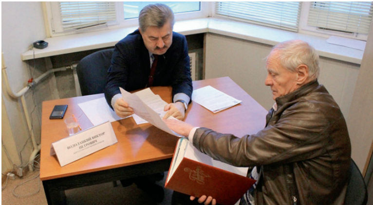
Депутат В. П. Водолацкий на приёме по личным вопросам в г. Ростов-на-Дону

и опор ЛЭП; заменена кровля над квартирой № 87 в многоквартирном доме № 69 по ул. Кондаурова в г. Азове Ростовской области; возобновлено строительство многоквартирного дома по адресу: Ростовская область, г. Азов, ул. Солнечная, 81; в г. Новочеркасске Ростовской области художнику-преподавателю оказана помощь в продлении аренды помещения для занятий; по просьбе руководства Луганского казачьего кадетского корпуса приобретено 40 парт и 80 стульев.