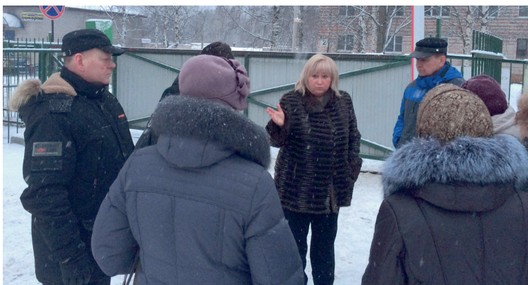
Депутат Е. А. Вторьгина на встрече с избирателями Архангельской области

В итоге, на прошедшем 26 июня заседании было принято решение с 1 июля 2015 года отстранить главного врача санатория от должности по ст. 278 ч. 2 Трудового кодекса (утрата доверия).