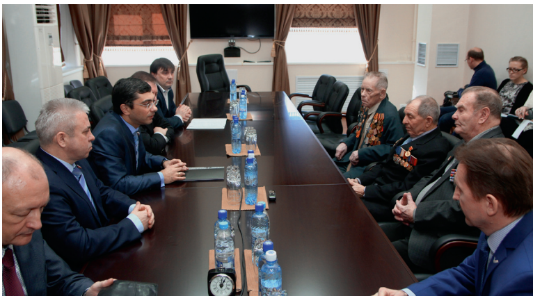
Депутат В. В. Гутенев на встрече с ветеранами войны г. Новокуйбышевска Самарской области

В рамках выездного приёма в г. Новокуйбышевске 2 марта 2015 года депутат Владимир Гутенев встретился с членами Новокуйбышевской городской общественной организации ветеранов войны, пострадавшими в результате действий руководства ОАО «Волга-кредит» банка.