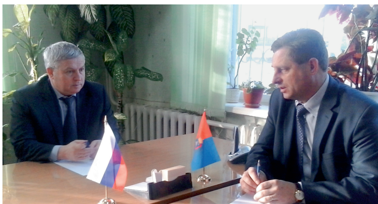
Депутат В. Б. Кидяев на личном приёме в Тамбовской области

Большую работу Виктор Кидяев ведёт с молодёжью. В феврале и апреле этого года группы студентов из Тамбовской области по его приглашению посещали Государственную Думу, присутствовали на пленарных заседаниях палаты парламента и смогли задать свои вопросы депутатам. В настоящий момент для наиболее талантливых студентов Тамбовского филиала Президентской академии организована практика в аппарате Комитета Государственной Думы по федеративному устройству и вопросам местного самоуправления.