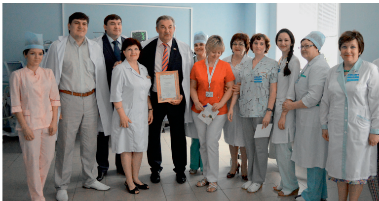
Депутат В. А. Третьяк передаёт оборудование Перинатальному центру Ульяновской областной клинической больницы

16 февраля депутат Владислав Третьяк и губернатор Ульяновской области Сергей Морозов посетили Николаевский район области, где провели торжественную церемонию открытия физкультурно-оздоровительного центра и подаренной депутатом многофункциональной хоккейной коробки стоимостью 860 тысяч рублей.