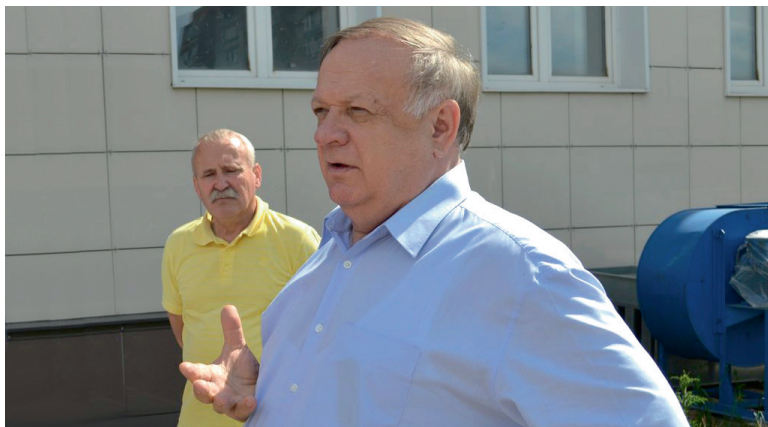
Депутат В. М. Заварзин посетил Онкологический центр г. Орска

Виктор Заварзин также проинформировал коллектив завода, что в Оренбурге будет построен новый цирк на 1200 мест. Сейчас идёт согласование проектно-сметной документации. Кроме того, пока будет вестись строительство нового стационарного цирка, откроется цирк-шапито. Таким образом, население не останется без ярких выступлений коллектива Оренбургского государственного цирка, которому, кстати, на днях исполнилось 80 лет. Цирк прошёл славный путь развития и завоевал высокий авторитет у широкой аудитории не только в России, но и далеко за её пределами.