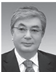
Председатель Сената Парламента Республики Казахстан Токаев Касым-Жомарт Кемелевич