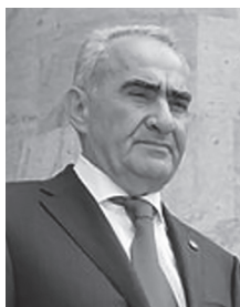
Председатель Национального Собрания Республики Армения Саакян Галуст Григорьевич