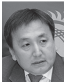
Председатель Жогорку Кенеша Кыргызской Республики Жээнбеков Асылбек Шарипович