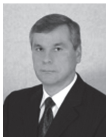
Председатель Палаты представителей Национального собрания Республики Беларусь Андрейченко Владимир Павлович