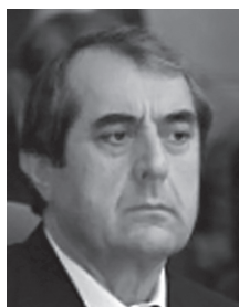
Председатель Маджлиси милли Маджлиси Оли Республики Таджикистан Убайдуллоев Махмадсаид Убайдуллоевич