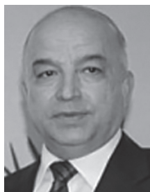
Председатель Маджлиси намоёндагон Маджлиси Оли Республики Таджикистан Зухуров Шукурджон Зухурович