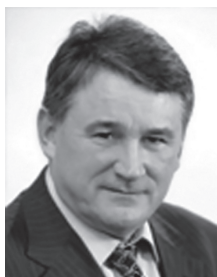
Заместитель Председателя Совета Федерации Федерального Собрания Российской Федерации Воробьев Юрий Леонидович